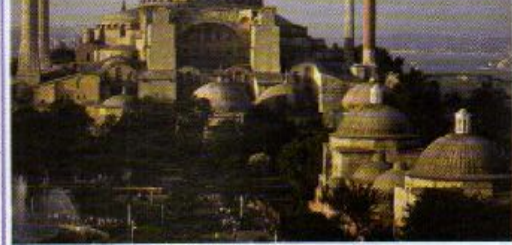
Храм Софии в Стамбуле