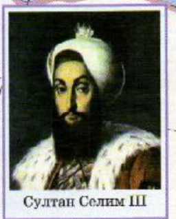
Султан Селим III

Районы и центры бабидских восстаний в Иране в 1848—1852 гг. Основные направления британской колониальной экспансии в 30—40-х годах XIX в. в Афганистан Районы, центры и годы национально-освободительного движения Граница территории, признанной владением России по Гюлистанскому мирному договору 1813 г. Границы государств в 1880 г. Цифрами на карте обозначены 1 Босния и Герцеговина — оккупированы Австро-Венгрией в 1878 г. 2 Валахия и Молдавия — автономны с 1829 г., объединились в единое государство Румыния в 1862 г. Румыния независима с 1878 г. 3 Восточная Румелия — отошла к Болгарии в 1885 г. 4 Черногория — независима с 1878 г. 5 Фессалия — отошла к Греции в 1881 г. 6 Хивинское ханство — протекторат России с 1873 г. Масштаб 1:20 000 000