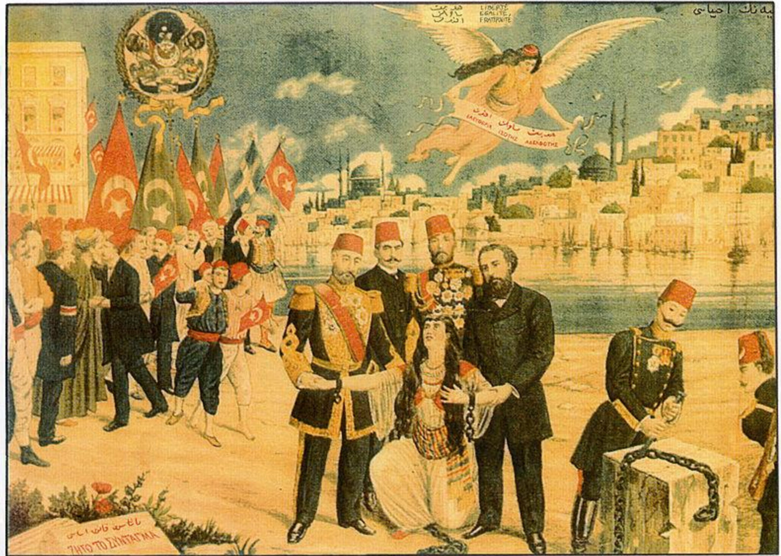
Didar-i Hürriyet kurtarılıyor (la Liberté sauvée) : carte postale de 1895, saluant la constitution ottomane du 23 novembre 1876, figurant le sultan Abdul-Hamid, les différents millets de l'empire (Turcs avec les drapeaux rouges, Arabes avec les drapeaux verts, Arméniens, Grecs) et la Turquie (non voilée) se relevant de ses chaînes. L'ange symbolisant l'émancipation porte une écharpe avec les mentions : « Liberté, Égalité, Fraternité » en turc et grec.

Турецкая открытка событий 1876 года. В центре стоят султан Абдул-Хамид II , Великий визирь и другие первые лица империи. Женщина в центре символизирует Турцию, которая скидывает оковы рабства. Летающий сверху ангел является намёком на Французскую революцию и её девиз «Свобода, равенство, братство». Все это происходит на фоне Стамбула