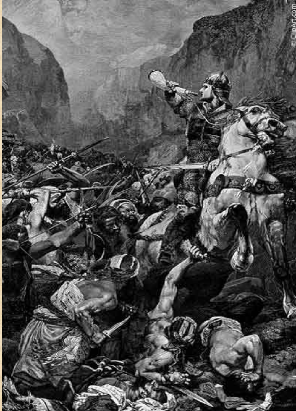
Roland, nephew of Charlemagne, Blowing the Horn

Две трети своего долгого правления — а это без малого 50 лет (768—814) — он провел в походах и сражениях, отвоевывая у соседей все новые и новые земли