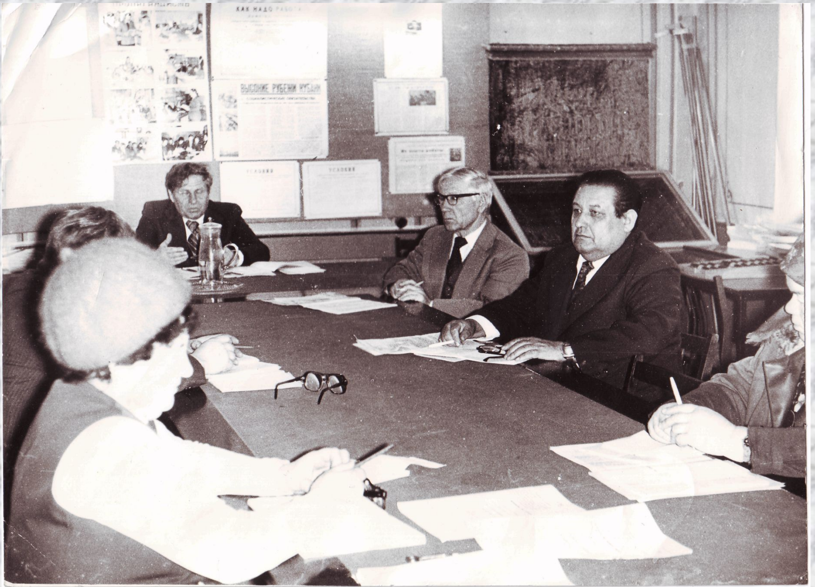
На заседании правления колхоза.