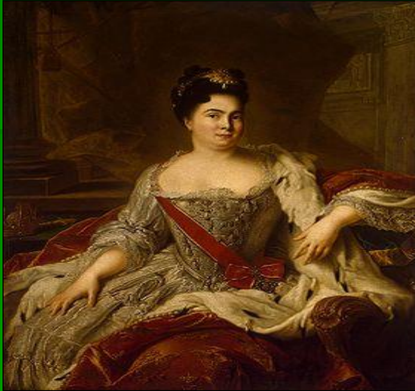
ЕКАТЕРИНА I (Марта Скавронская)