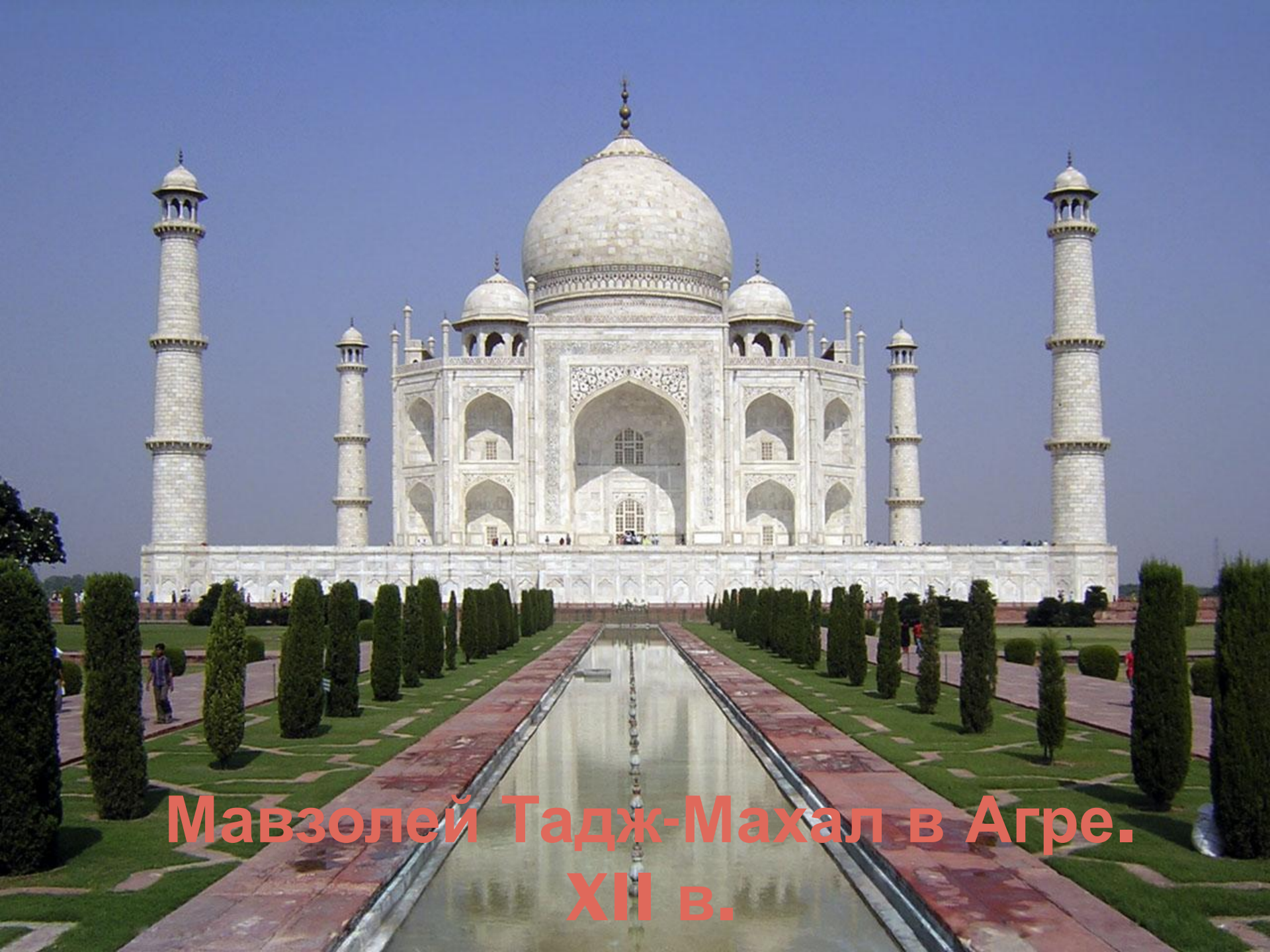
Мавзолей Тадж-Махал в Агре. XII в.