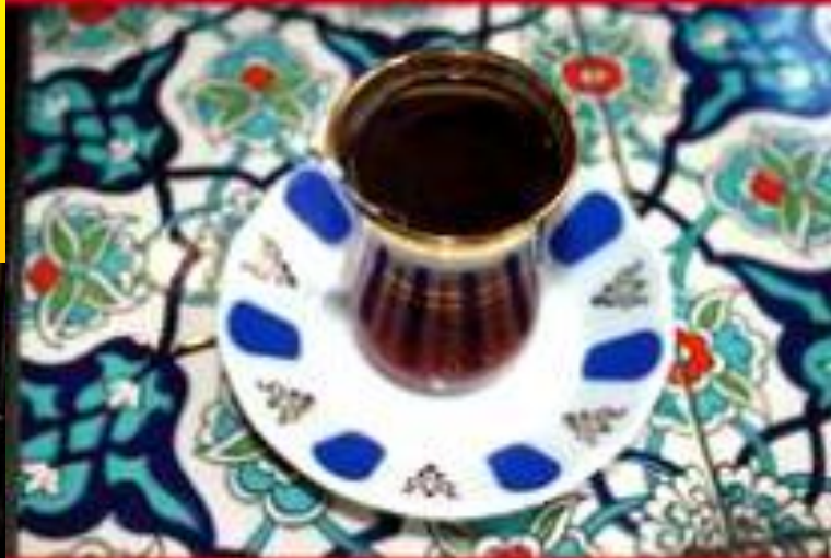
İsmail Paşa'nın Çayhanı Çayhanı