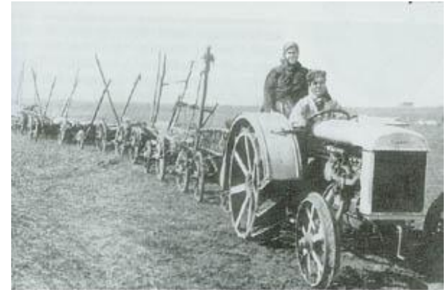
Новая техника на колхозных полях.