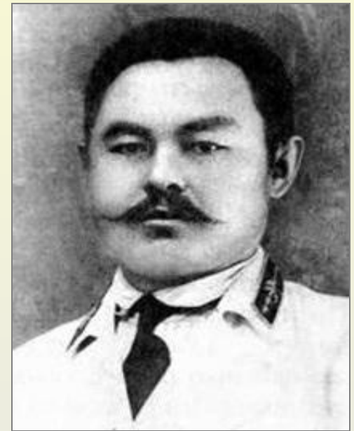
М.Тынышпаев – инженер, один из проектировщиков Турксиба