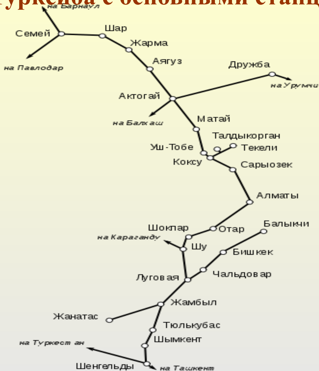
Схема Турксиба с основными станциями