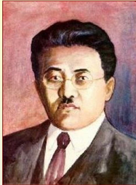
Т. Рыскулов – глава Комитета содействия строительству Турксиба от СНК РСФСР