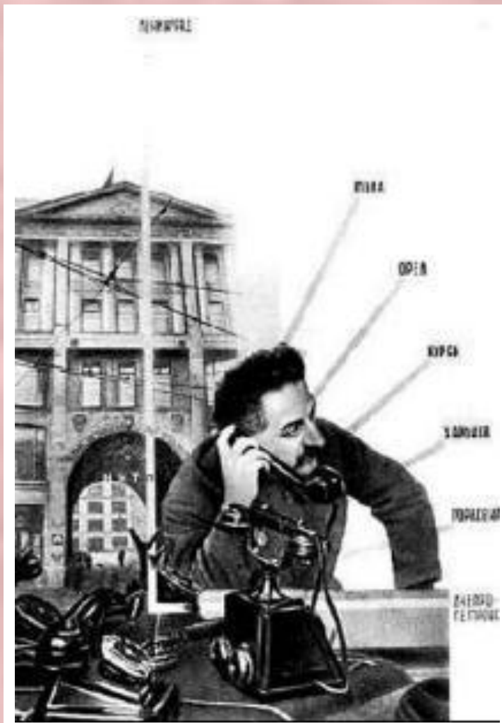
Г.Орджоникидзе. Нарком тяжелого машиностроения.

Выполнение заданий 2-й пятилетки привело к превращению СССР из аграрной страны в мощную индустриальную державу. Рост промышленности составил 2,2 раза. 80% прироста было достигнуто за счет вновь построенных предприятий. Намеченный Сталиным 10-летний срок страна смогла преодолеть путем невероятных усилий и СССР вышел на 1 место в Европе по объему промышленного производства.