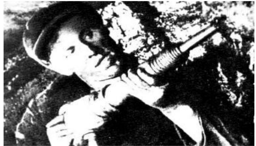
А.Стаханов. в шахте

2 пятилетка не привела к повышению уровня жизни населения. Отменялись карточки на продовольствие, но общий уровень цен повысился. Рабочие вынуждены были подписываться на государственные займы. Жилищные условия не улучшались, т.к. число жителей в городах росло.