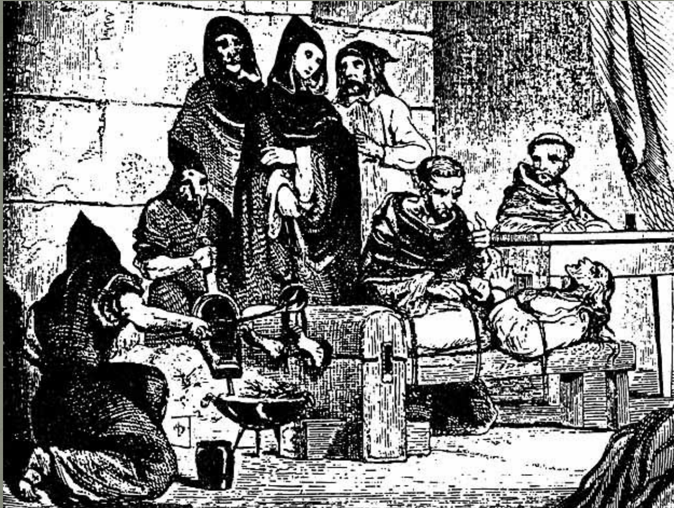
Иллюстрация к "Истории инквизиции М. де Фереа. XIX в.