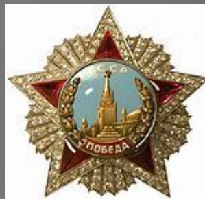
Орден «Победа» ( 2 шт. )