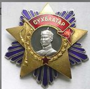
Орден Сухэ- Батора (2 шт.)