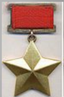
Герой Советского Союза