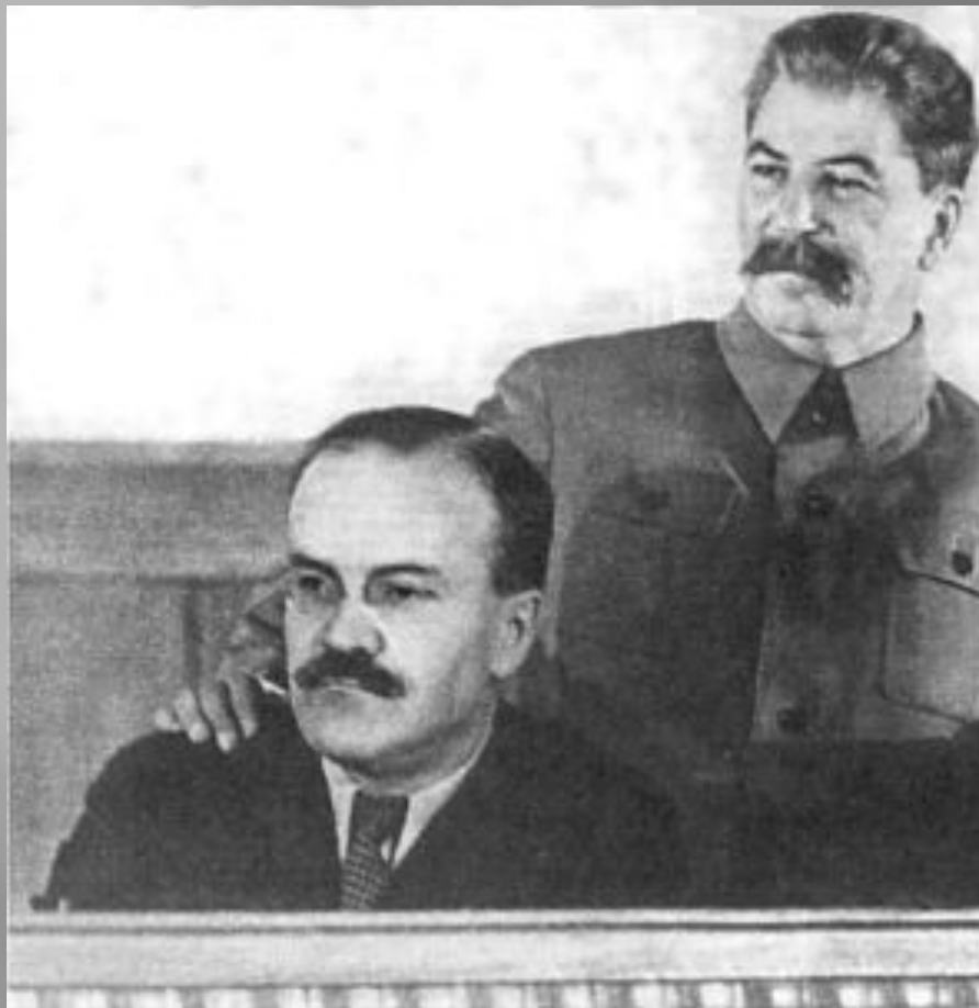
Молотов и Сталин