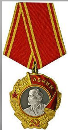
Орден Ленина ( 3 шт. )