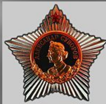
Орден Суворова степени