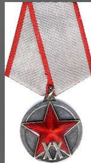
Юбилейная медаль «XX лет Рабоче- Крестьянской Красной Армии»