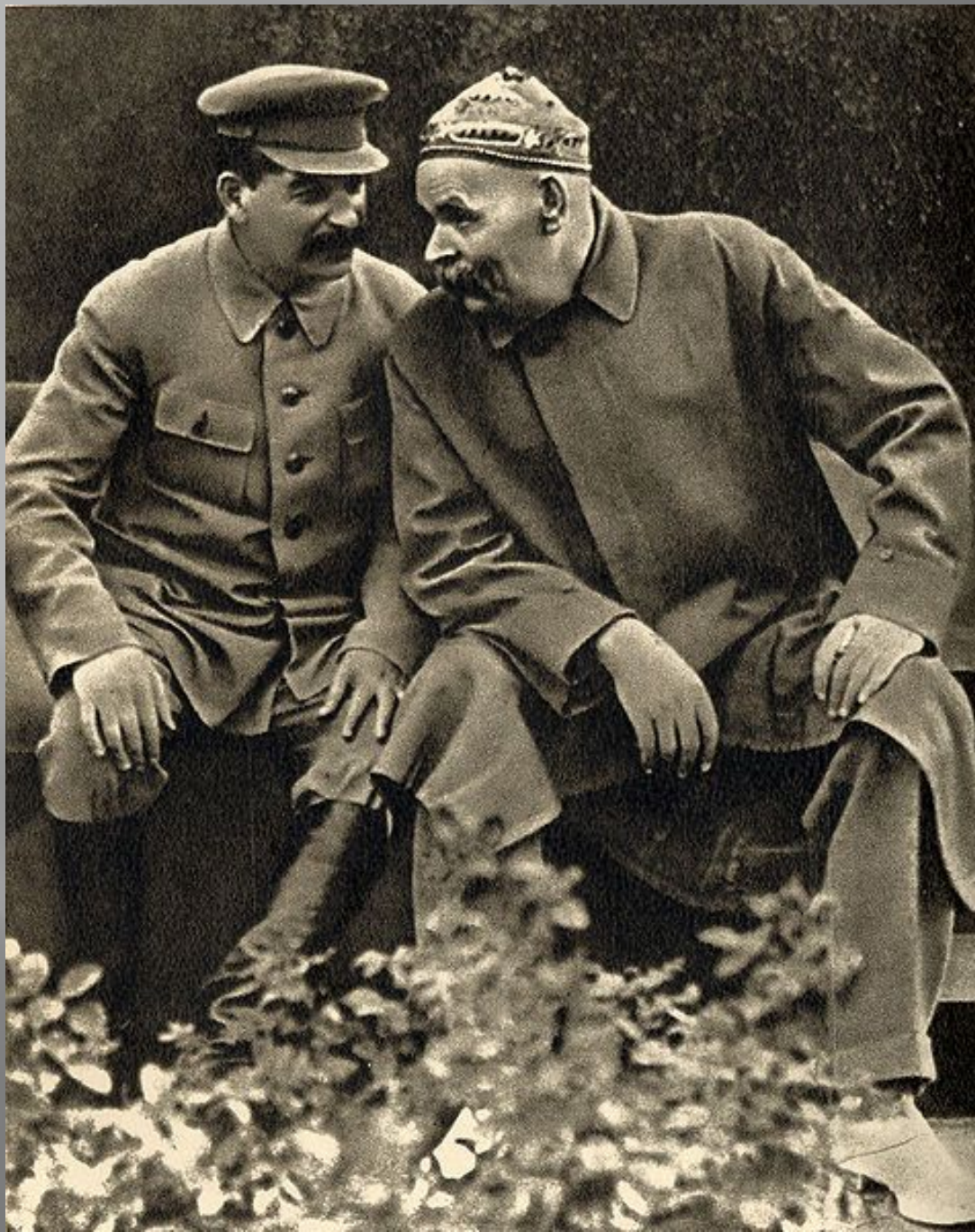
Иосиф Сталин и Максим Горький в скверике на Красной площади, 1931 год