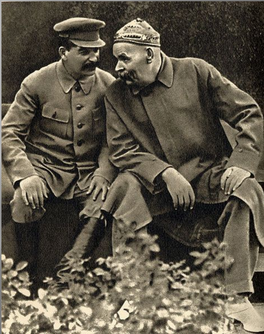
Иосиф Сталин и Максим Горький в скверике на Красной площади, 1931 год