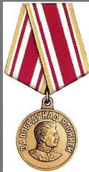
Медаль «За победу над Японией»