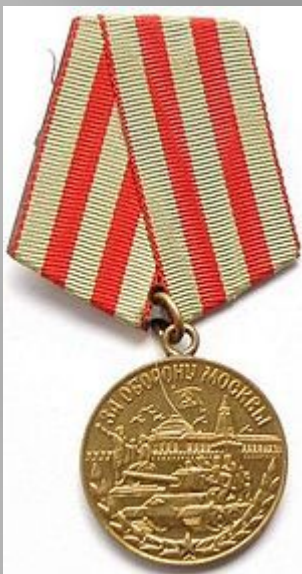
Медаль «За оборону Москвы»