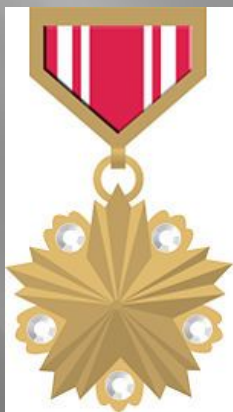
Герой Монгольской Народной Республики