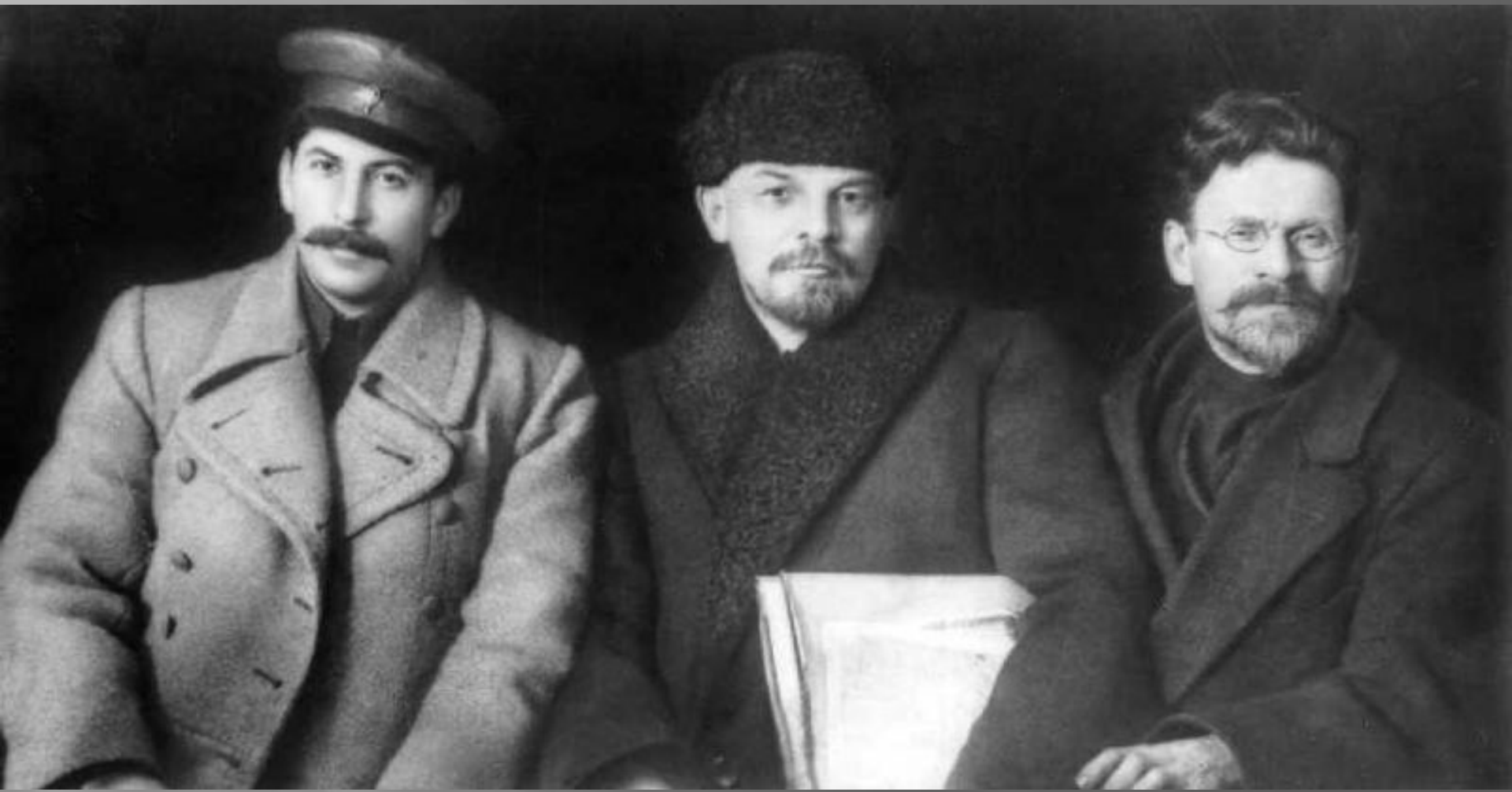
Сталин, Ленин и Калинин. 1919 год