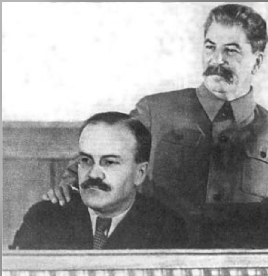
Молотов и Сталин