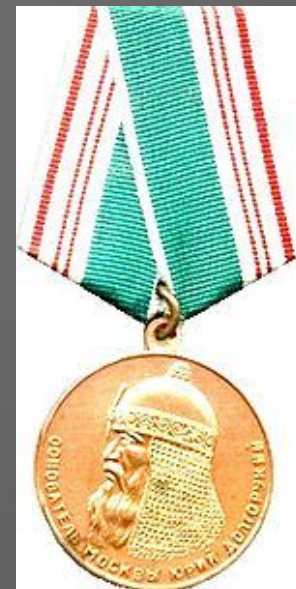
Медаль «В память 800- летия Москвы»