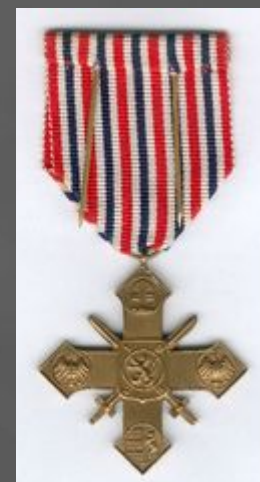
Военный крест (Чехословакия, 1939)