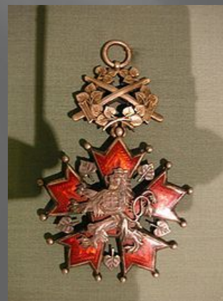
Орден Белого льва