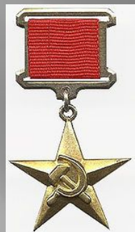
Герой Социалистического Труда