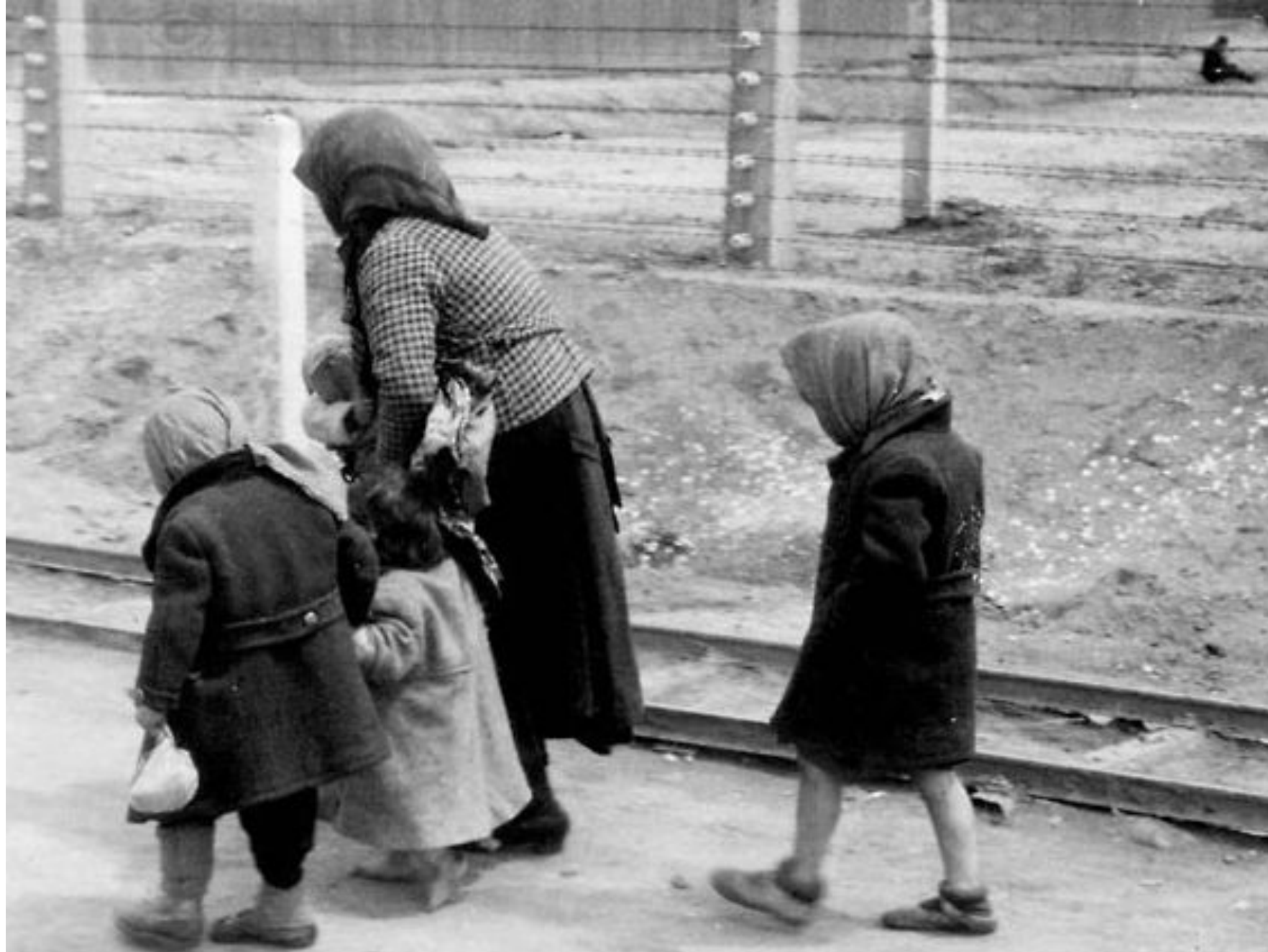
Аушвиц-Биркенау, Польша. Женщина и дети, признанные непригодными к работе, на пути в газовые камеры.