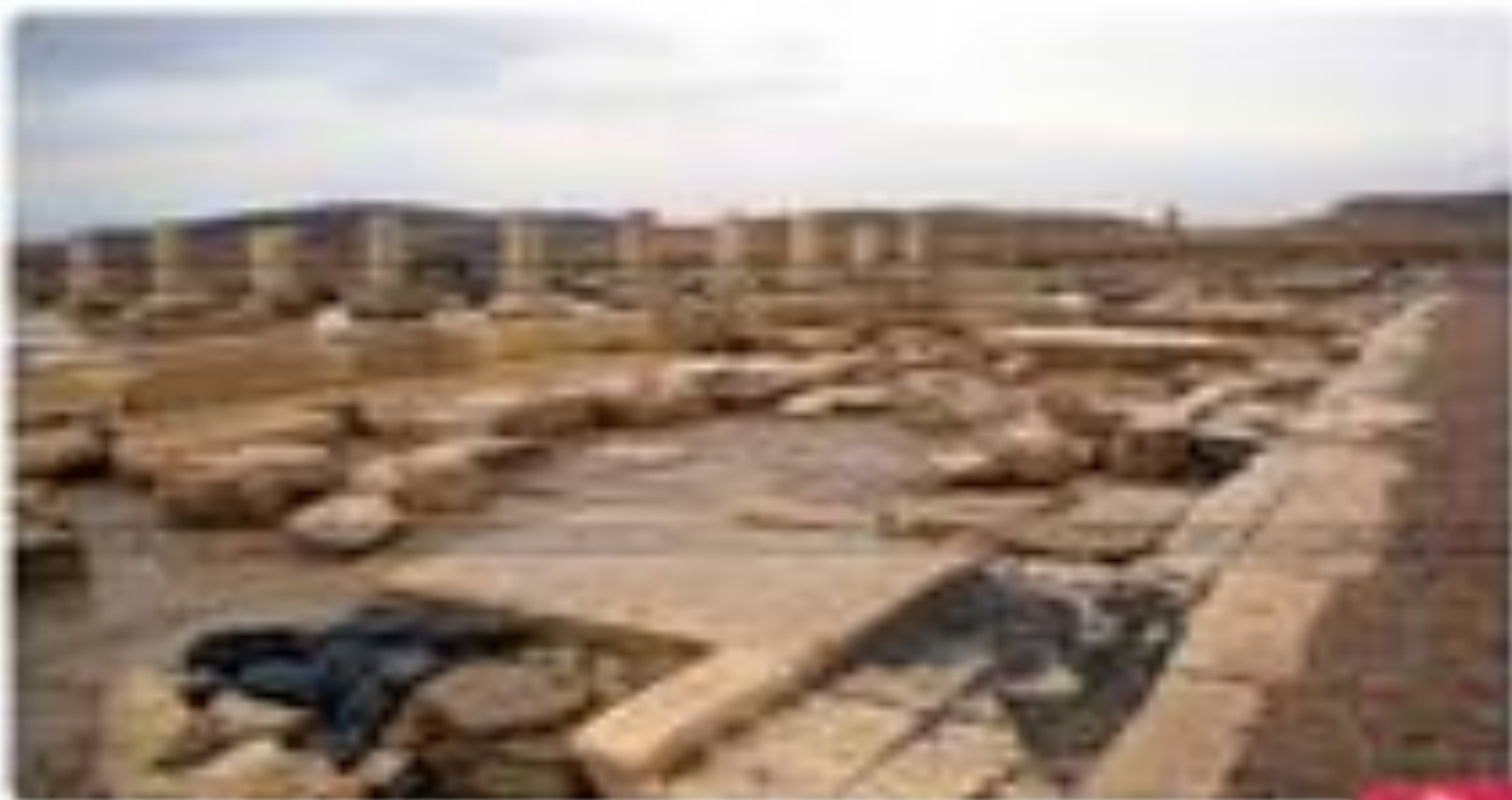
Первая столица персов в Пасаргадах, Иран.