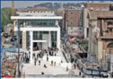
Музей "Алтаря мира"

Алтарь Мира был создан при Августе , он должен был увековечить воссоединение сторонников нового режима и потерпевших поражение республиканцев. Алтарь представляет собой отдельно стоящее здание без крыши, служившее ограждением жертвенника. Ограду украшали рельефы, разделенные на два яруса фризом с меандровым орнаментом (ленточный орнамент в виде ломаной линии). Нижний рельеф изображал стебли, листья и завитки Древа Жизни, населенного птицами и другой живностью, на верхнем рельефе было запечатлено торжественное шествие, включавшее членов императорского дома. Здесь использован греческий прием изокефалии — все головы находятся на одном уровне, однако изображение оживляют фигуры детей разных возрастов. Некоторые фигуры на рельефе оборачиваются — в этом его существенное отличие от классических греческих памятников. Помимо этого, лица персонажей наделены индивидуальными чертами, они портретны.