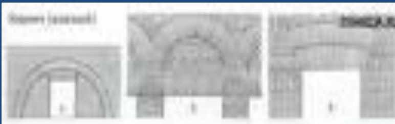
примеры арок из кирпича (римская империя)

Самые древние известные нам римские арки сооружены в акведуке 144 года до нашей эры. Они шириной всего шесть метров. Еще не достаточно строительного опыта. Но проходит меньше ста лет, и ширина арки достигает 16 метров. Остается только восхищаться инженерными расчетами римлян.