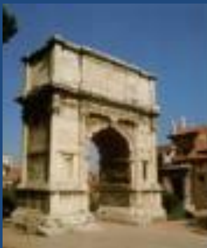
Триумфальная арка Тита

Одним из шедевров зодчества эпохи Флавиев является знаменитая Триумфальная арка Тита . Тит, считавшийся здравомыслящим и исполненным благородства императором, правил сравнительно недолго (79-81 гг.) Арку воздвигли в честь правителя в 81 году, уже после его смерти. Она увековечила поход Тита в 70 году на Иерусалим и разграбление там храма Соломона. Арка отличается мощной декоративной отделкой с превосходной проработкой сложной римской капители. По сторонам проема арки Тита стоят по две коринфские колонны. Украшает арку высокая надстройка - аттик с посвящением Титу от "сената и народа римского". Наверху статуя императора на колеснице, запряженной четверкой лошадей. В аттике был захоронен прах Тита. Арка являлась архитектурным сооружением, постаментом для статуи и одновременно мемориальным памятником. Так хоронили лишь людей с особой харизмой ( в переводе с греческого - "милость", "божественный дар" ), т.е. наделенных исключительными личными качествами - мудростью, героизмом, святостью: Цезаря на Римском Форуме , Тита в его арке, Траяна в цоколе его колонны. Другие граждане покоились вдоль дорог за городскими воротами Рима. Внутри арки помещены высокие рельефы с изображением триумфального шествия: Тит едет на квадриге, его солдаты шествуют к арке с трофеями. Изображенные внутри арки сцены соответствуют моменту прохождения через нее, таким образом зритель невольно приобщается к действию ,как бы становится участником сцены.