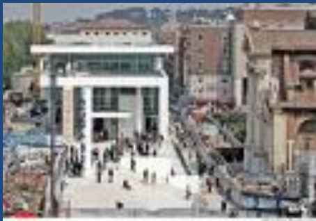
Музей "Алтаря мира"

Алтарь Мира был создан при Августе , он должен был увековечить воссоединение сторонников нового режима и потерпевших поражение республиканцев. Алтарь представляет собой отдельно стоящее здание без крыши, служившее ограждением жертвенника. Ограду украшали рельефы, разделенные на два яруса фризом с меандровым орнаментом (ленточный орнамент в виде ломаной линии). Нижний рельеф изображал стебли, листья и завитки Древа Жизни, населенного птицами и другой живностью, на верхнем рельефе было запечатлено торжественное шествие, включавшее членов императорского дома. Здесь использован греческий прием изокефалии — все головы находятся на одном уровне, однако изображение оживляют фигуры детей разных возрастов. Некоторые фигуры на рельефе оборачиваются — в этом его существенное отличие от классических греческих памятников. Помимо этого, лица персонажей наделены индивидуальными чертами, они портретны.