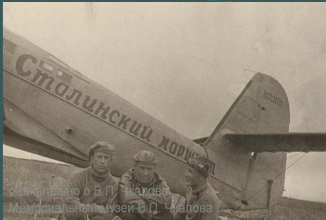
связано о В.П. Чкалове Мемориальный музей В.П. Чкалова

Всем колхозам, заводам и предприятиям давались яркие социалистические «имена». Нашему колхозу было присвоено название «Память Чкалова». Валерий Чкалов – это наш земляк, нижегородец. Два дальних беспосадочных перелета, совершенных под его командованием, навсегда вошли в историю отечественной и мировой авиации.