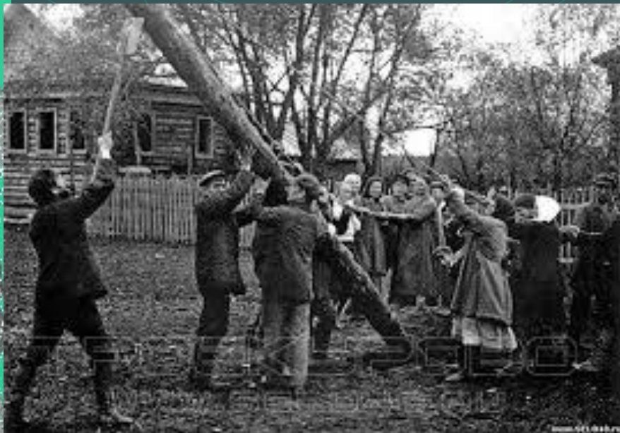
Электроопоры ставили всем миром