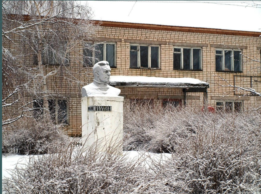
Старое здание правления колхоза и бюст Валерию Чкалову

Практическая значимость работы определяется возможностью её использования в исследованиях краеведческого характера.