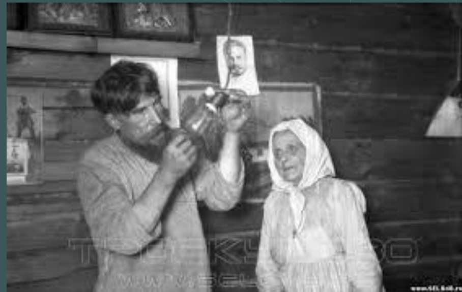
Лампочку считали чудом