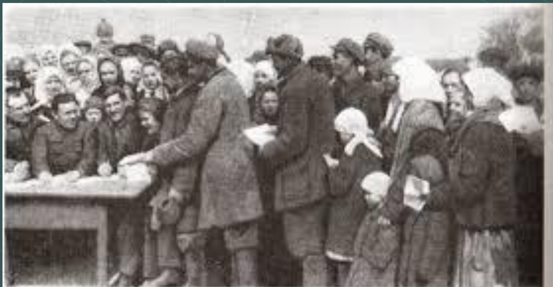
Подача прастыянамі давакнення о прыняцці в колхоз, Борысаглебеный район Цэнтральнай чэрвоземной области. 1929 г. Фота