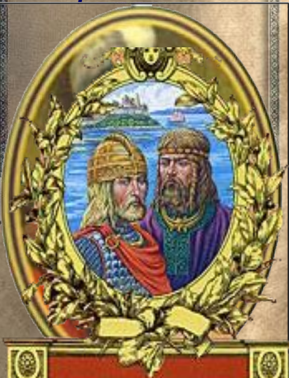
Аскольд и Дир