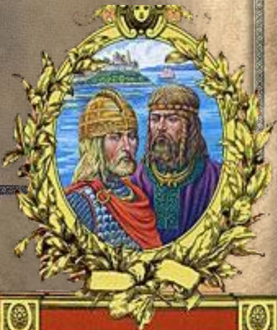
Аскольд и Дир