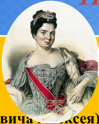
Пётр (сын царевича Алексея)