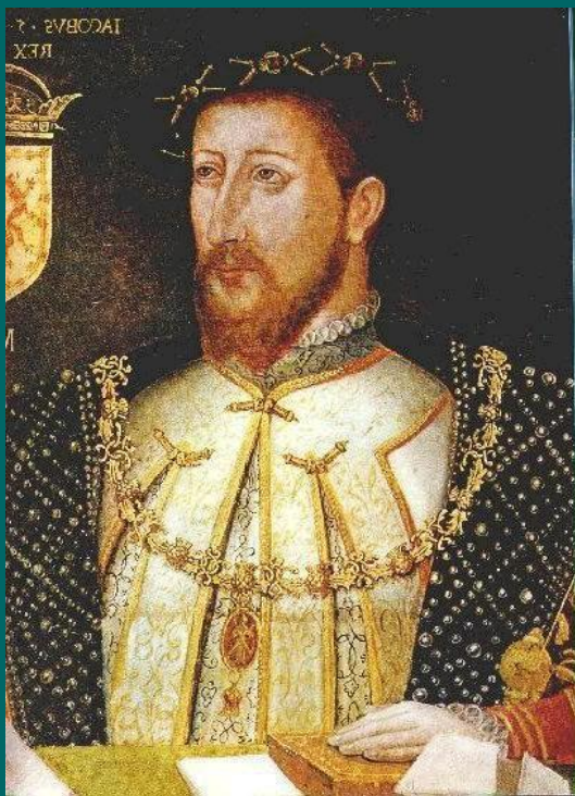
Яков I Стюарт

Вступивший на английский трон после Елизаветы Яков I Стюарт (1603-1625) в течение всего своего правления боролся с парламентом, всячески ограничивая его роль.