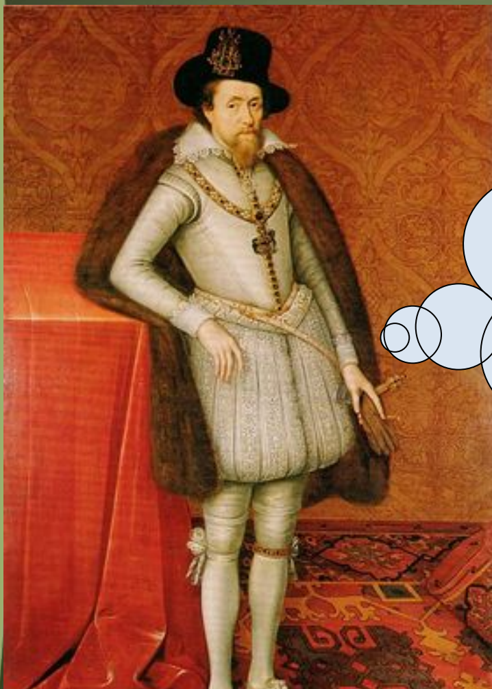
Яков I Стюарт

« Рождённый подданным должен повиноваться »