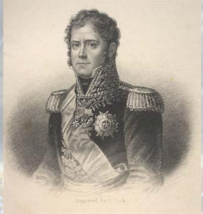
Ней Мишель, маршал Франции