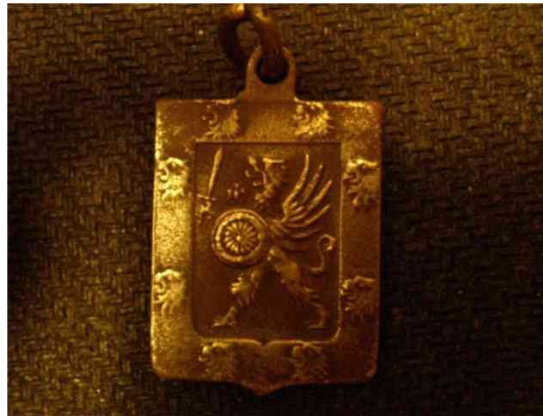
Фамильный герб дома Романовых. Найден на Нарове.