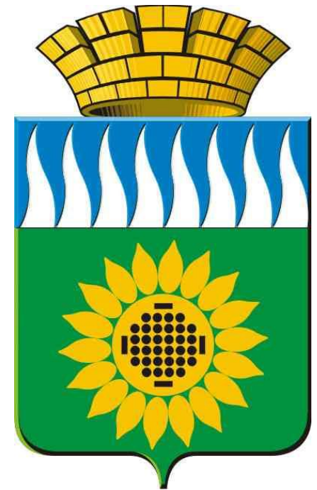
Свердловская область. Герб города Заречный