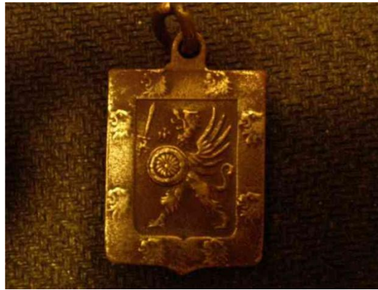
Фамильный герб дома Романовых. Найден на Нарове.