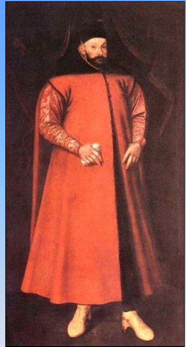
Стефан Баторий Великий Князь Литовский и Король Польский

В 1572 году в Речи Посполитой после смерти Жигимонта Августа начался период безкоролевья. Свою кандидатуру на трон Речи Посполитой выставлял и царь Иван Грозный. Избрание Стефана Батория королём перечило планам Москвы и в 1577 году она возобновляет военные действия и захватывает большую часть территории Инфлянтов, принадлежавшей Речи Посполитой. В ответ по инициативе Батория в стране начинается подготовка к широко-масштабной военной кампании. Первоочередная цель – возвращение Полоцка. Менее, чем за месяц город был взят 40-тысячным войском. Во время этой кампании от врага была освобождена