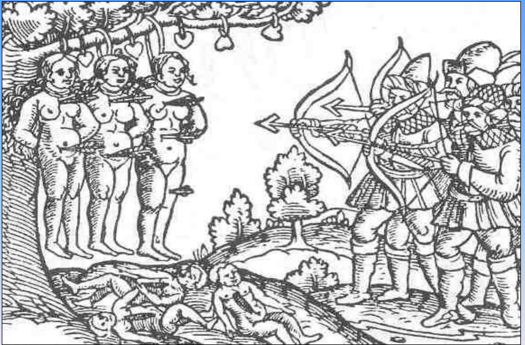
Зверства московитов в Ливонии, средневековая гравюра