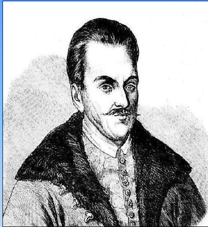
Роман Сангушка Польный гетман ВКЛ

В 1566 – 1567 гг. москвиты несколько замков на Полоччине. Для противодействия на Полоччину послали Польного гетмана ВКЛ Романа Сангушку, который за короткое время смог организовать оборону и продвижение москвитов. Осенью 1567 года под Молодечном и Радошковичами было собрано огромное, по меркам ВКЛ, посполитое рушенье в 30000 конных воинов. Однако, никаких активных действий командование этого войска, которое возглавил сам Жигимонт Август, не предпринимало. Только по