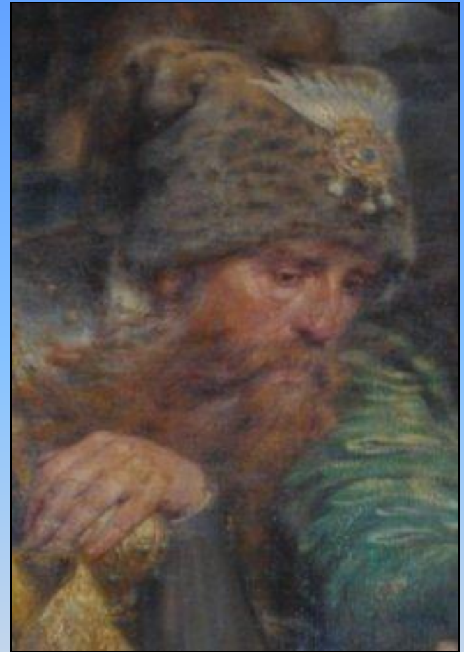
Николай Радзивилл Руды Великий гетман ВКЛ в 1553 – 1566 и 1576 -1584 гг.

Взятие Полоцка было крупнейшим событием 1-го периода войны. ВКЛ потеряло значительные территории и инициатива в войне перешла к Москве. Затем в 1563 году с Полоцка и Смоленска выступила армия общей численностью около 70-80 тысяч. 18-тысячная группировка Шуйского, благодаря неожиданному нападению, была полностью разбита Николаем Радзивиллом Рудым на реке Ула. В битве погиб и сам Шуйский. С этого времени Москва избегала крупных столкновений с литвинами. В 1565 – 1566 военные действия угасли в связи со внутренними проблемами в государствах и эпидемией чумы в