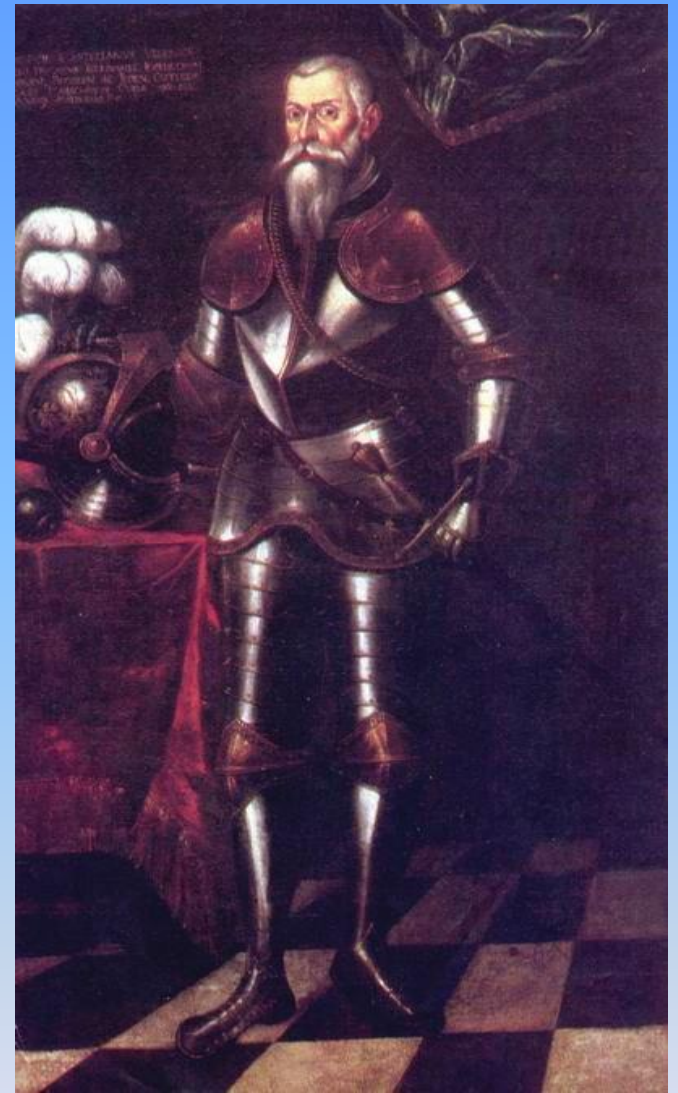
Юрий Радзивилл Великий Гетман Литовский в 1531 – 1541 гг.

В начале августа 1534 года великий гетман Юрий Радзивилл привёл 20-тысячное войско под Могилёв, оттуда корпус И.Вишневецкого был направлен к Смоленску, корпус А. Немировича – в Северскую землю. Но первый не смог захватить Смоленск, а второй захватил только Радогощ, держал в осаде Почеп, Стародуб, Чернигов. Вернувшись, войско было распущено. А зимой внезапно в Литву ворвались московские воеводы, которые не встретили практически никакого сопротивления и разрушили небольшие неукреплённые города, дошли до Браслава и Новогородка. К следующей военной компании ВКЛ, помимо собственной земской службы, наняло за свои деньги 5