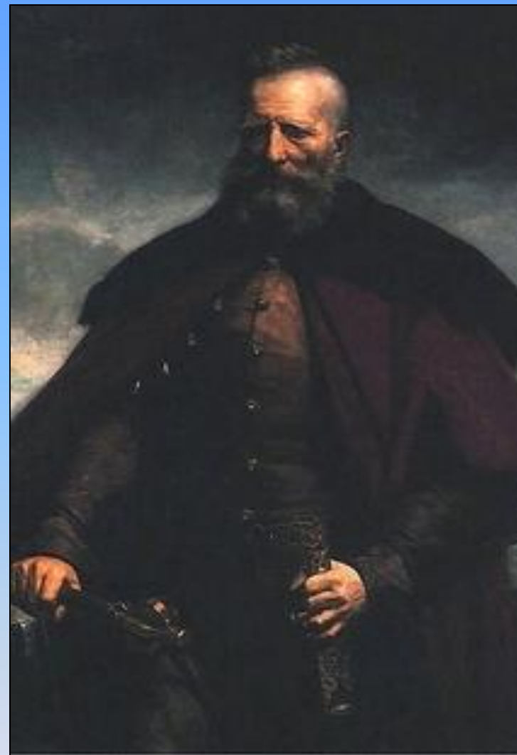
Ян Кароль Ходкевич Великий гетман ВКЛ

В это же время Ф.Кмита провёл удачную операцию в околицах Смоленска. Однако, настоящего успеха достиг в 1568 году Сангушка, штурмом был взят замок Ула. Затем литвинам удалось на некоторое время завладеть Изборском в Псковской земле. Баланс сил в войне постепенно выравнивался. Война выявила недостаточность внутреннего потенциала ВКЛ для достижения успеха. Нужна была поддержка со стороны Польши. Однако поляки требовали за военную помощь заключения унии на новых условиях. Эта война стала мощным катализатором Люблинской унии.