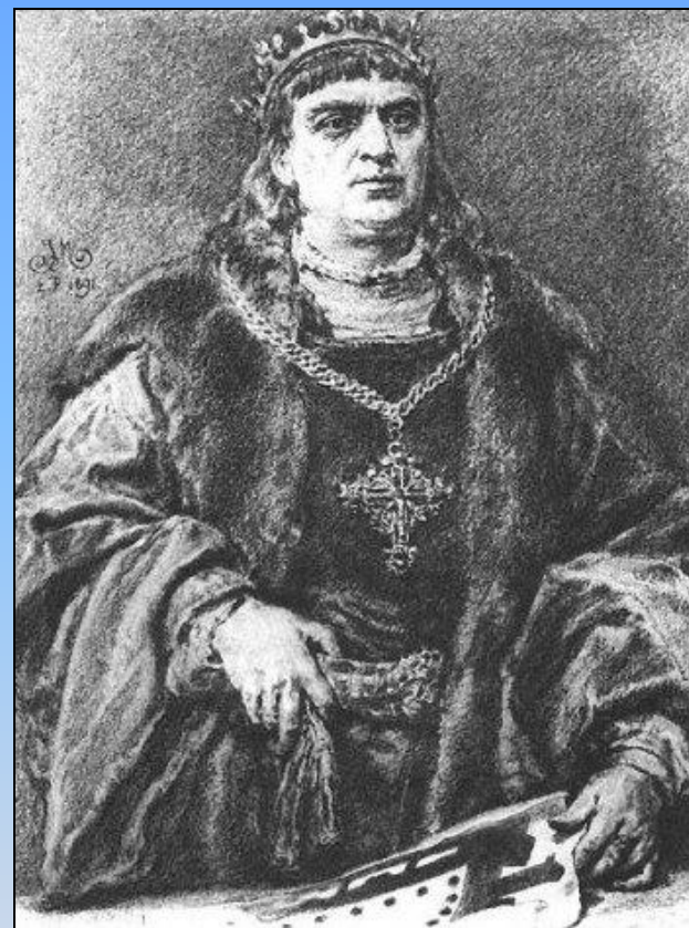
Жигимонт II Старый Великий Князь ВКЛ и Король Польский

Война за православные земли, входившие в состав ВКЛ. Виленский сейм в феврале 1507 года принял решение о возвращении земель, потерянных во время предыдущих (1492 – 94, 1500 – 03) войн. В марте – апреле 1507 года посольство Жигимонта II Старого в Москве в форме ультиматума потребовало вернуть города и земли, захваченные Иваном III. Московское правительство не приняло требование и объявило о готовности начать войну. Уже в апреле 1507 года Василий III направил конные полки на Полоцк и Смоленск. Обойдя