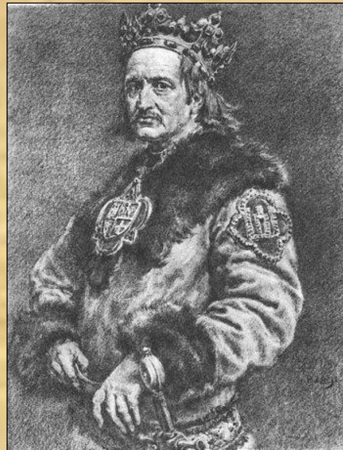
Владислав I Ягайло Великий Князь ВКЛ в 1377 – 1381, 1382 – 1392 гг.

На стороне Витовта воевали жемайты во главе с начальником крестоносцев Жемайтии, отряды комтура Рогнеты и поляков. В это же время на Псков напали наши союзники – отряды рыцарей Ливонского Ордена. Осенью 1406 года было заключено перемирие до 15 мая 1407 года. Уже 20 мая 1407 года Витовт сжёг Адоев и напал на Новосильское Княжество. Василий I в августе сжёг Дмитровец, а затем под Вязмой было заключено