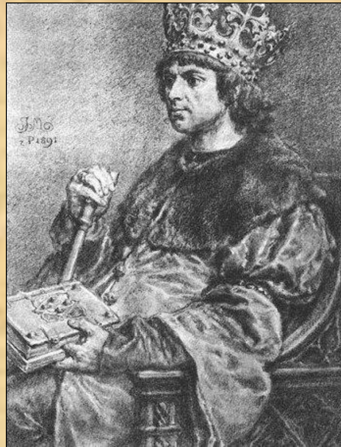
Александр II Ягеллончик Великий Князь ВКЛ в 1492 – 1506 гг. Король Польский в 1501 – 1506 гг.

ВКЛ не было готово к обороне, поэтому Александр II посылает послов в Крым, Заволжскую Орду и к своему брату Королю Польскому Яну Альбрехту с просьбой о помощи. Чтобы остановить агрессию Виленский Двор предложил выдать дочку Ивана III Алёну за Великого Князя Александра II . Начались переговоры, в которых Москва пыталась получить как можно больше