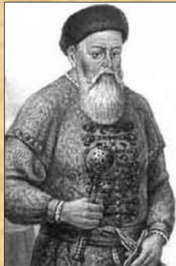
Константин Иванович Острожский Великий Гетман Литовский в 1497-1500, 1507 -1530 гг.

В конце июня к Смоленску подошёл конный корпус во главе с Великим Гетманом Литовским К.И.Острожским. 14 июля 1500 года 4000 отряд Острожского атаковал 40000 войско Москвы на реке Ведроша под Дорогобужем и в 6-часовой битве был практически полностью уничтожен. Иван III требовал от Менгли-Гирея совершить обещанное нападение на ВКЛ в направлении Слуцк – Туров – Пинск – Менск.