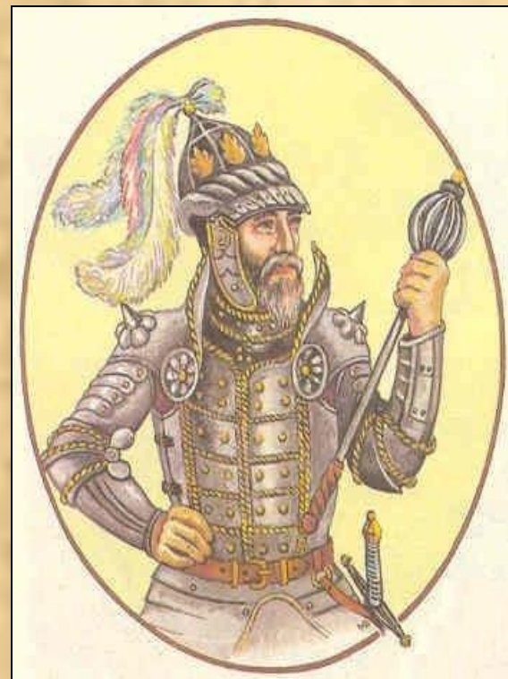
Альгерд Великий Великий Князь ВКЛ

Была вызвана соперничеством между двумя крупнейшими государствами Восточной Европы за доминирование в регионе, в первую очередь за влияние на Тверское Княжество. Великий Князь Московский Дмитрий Донской не признал перехода власти к Михаилу Александровичу (брату Ульяны, жены Альгерда), сторонника суверенитета Твери и сближения её с ВКЛ. Был вынужден бежать в