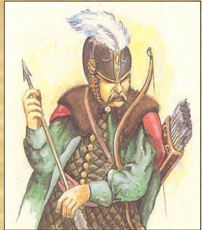
Свидригайла Великий Князь ВКЛ

В июле 1408 года в Москву сбежал князь Свидригайла (будущий Великий Князь ВКЛ) с группой менее влиятельных князей и бояр. Осенью 1408 года в устье реки Угра без битвы был заключен «вечный мир». ВКЛ сохранило за собой свои владения, а также Витовту удалось закрепиться на землях Верхней Оки и подчинить