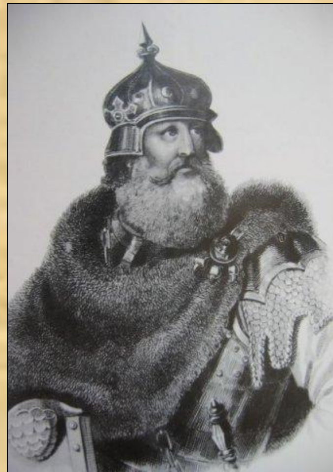
Кейстут Великий Князь ВКЛ

Чтобы предотвратить его, 7 апреля 1372 года одновременно с выступлением Михаила войско ВКЛ во главе с Кейстутом и Андреем Альгердовичем напали на Переяслав-Залесский. Затем в 12 июля 1372 года тверское войско и войско ВКЛ во главе с Альгердом соединились возле г. Любуцк для 3-го похода на Москву. Но не имея достаточных сил для того, чтобы склонить успех в войне