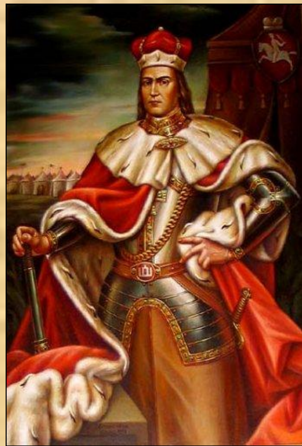
Александр I Витовт Великий Князь ВКЛ

Была вызвана боязнью Москвы дальнейшего укрепления ВКЛ после окончательного подчинения Великим Князем Витовтом в 1404 году Смоленского Княжества. В феврале 1406 года Витовт Великий напал на Псков, что вызвало безуспешный майский поход Василия I на Вязьму и Серпейск. В ответ Витовт захватил Воротыньск и Козельск и поселил там