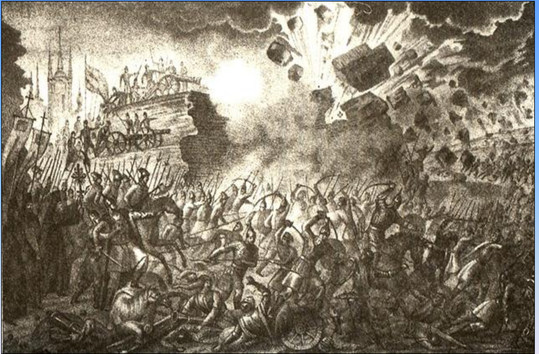
Осада Пскова войсками Стефана Батория