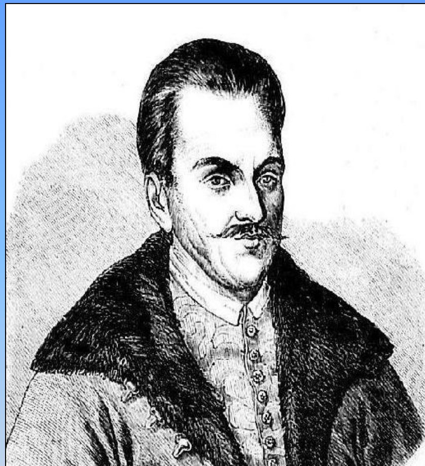
Роман Сангушка Польный гетман ВКЛ

В 1566 – 1567 гг. московиты несколько замков на Полоччине. Для противодействия на Полоччину послали Польного гетмана ВКЛ Романа Сангушку, который за короткое время смог организовать оборону и продвижение московитов. Осенью 1567 года под Молодечном и Радошковичами было собрано огромное, по меркам ВКЛ, посполитое рушенье в 30000 конных воинов. Однако, никаких активных действий командование этого войска, которое возглавил сам Жигимонт Август, не предпринимало. Только по