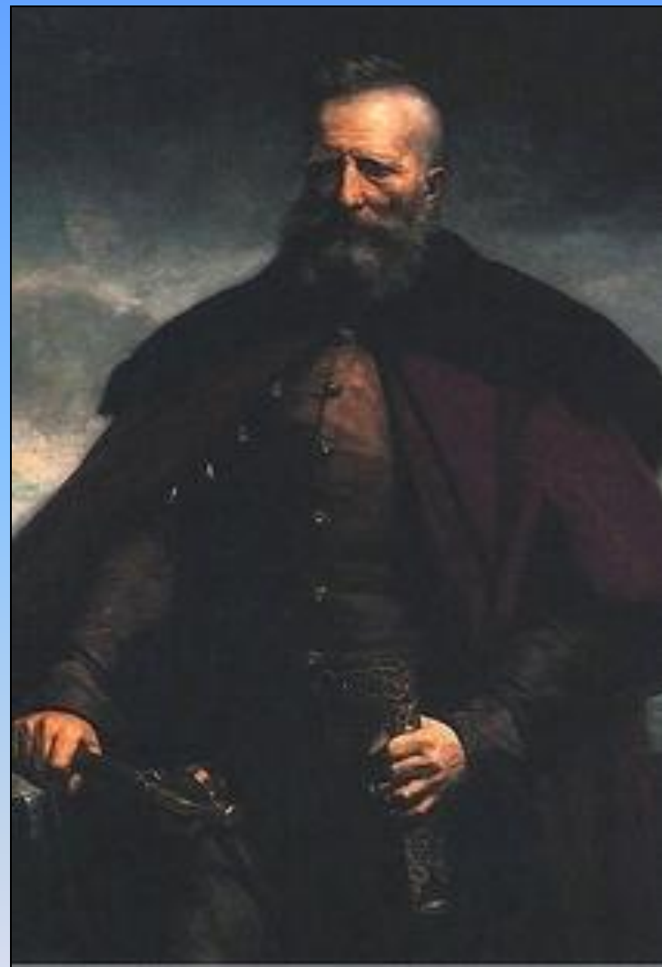
Ян Кароль Ходкевич Великий гетман ВКЛ

В это же время Ф.Кмита провёл удачную операцию в околицах Смоленска. Однако, настоящего успеха достиг в 1568 году Сангушка, штурмом был взят замок Ула. Затем литвинам удалось на некоторое время завладеть Изборском в Псковской земле. Баланс сил в войне постепенно выравнивался. Война выявила недостаточность внутреннего потенциала ВКЛ для достижения успеха. Нужна была поддержка со стороны Польши. Однако поляки требовали за военную помощь заключения унии на новых условиях. Эта война стала мощным катализатором Люблинской унии.