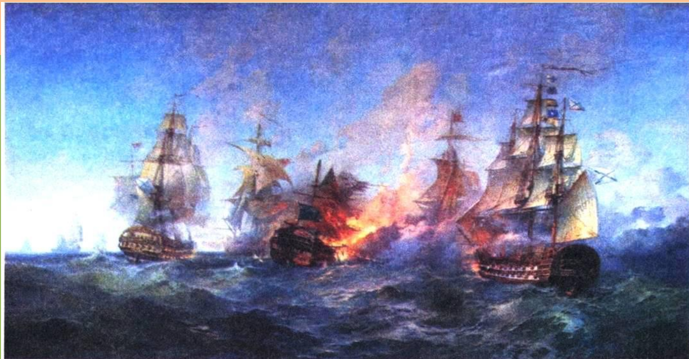
Сражение у острова Тендра. Художник А. Блинков