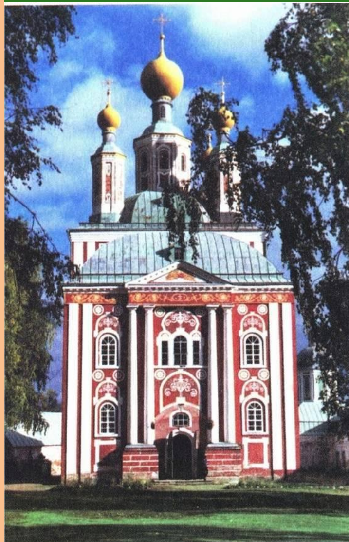
Рождество-Богородицкий собор в Санаксарском монастыре