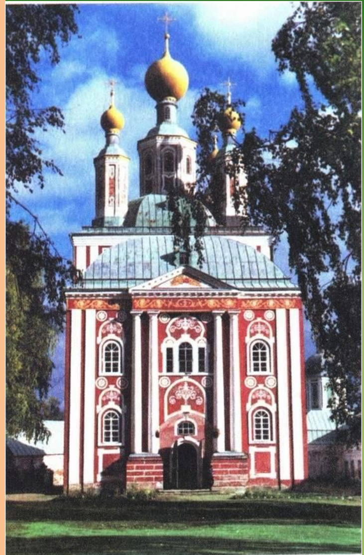
Рождество-Богородицкий собор в Санаксарском монастыре