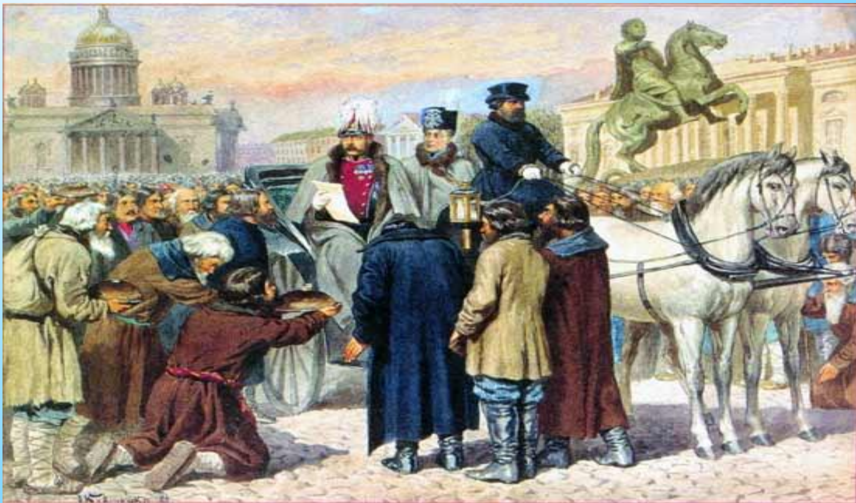
Чтение Манифеста 19 февраля 1861 года Александром II на Сенатской площади в Санкт-Петербурге. С картины художника А.Д. Кившенко