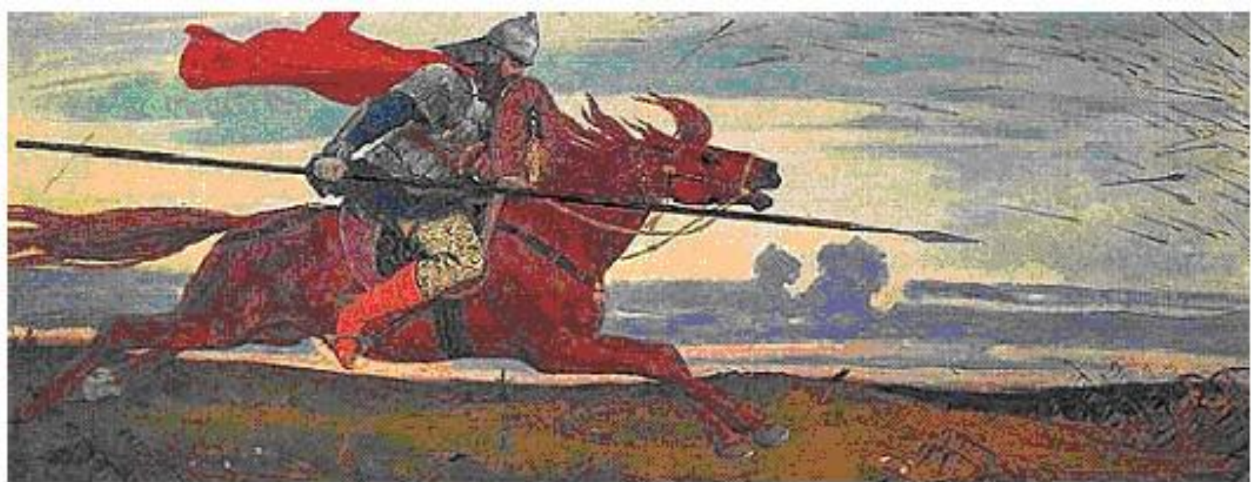
В. Васнецов. Один в поле воин. 1921.