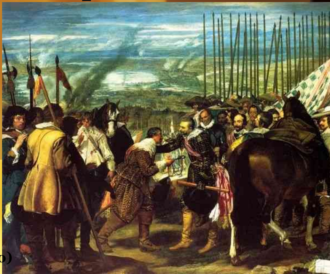
Сдача Бреды Веласкеса (1629-1631, Мадрид, Прадо)