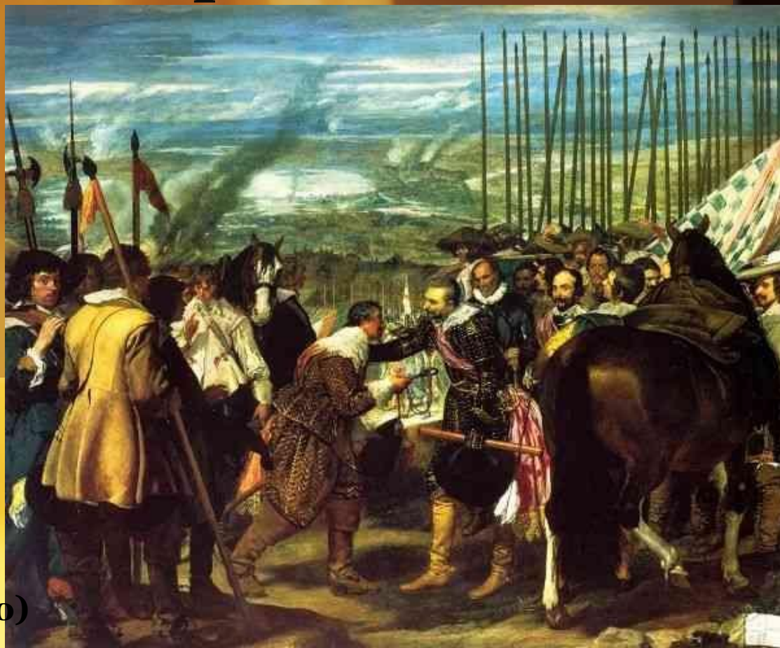
Сдача Бреды Веласкеса (1629-1631, Мадрид, Прадо)