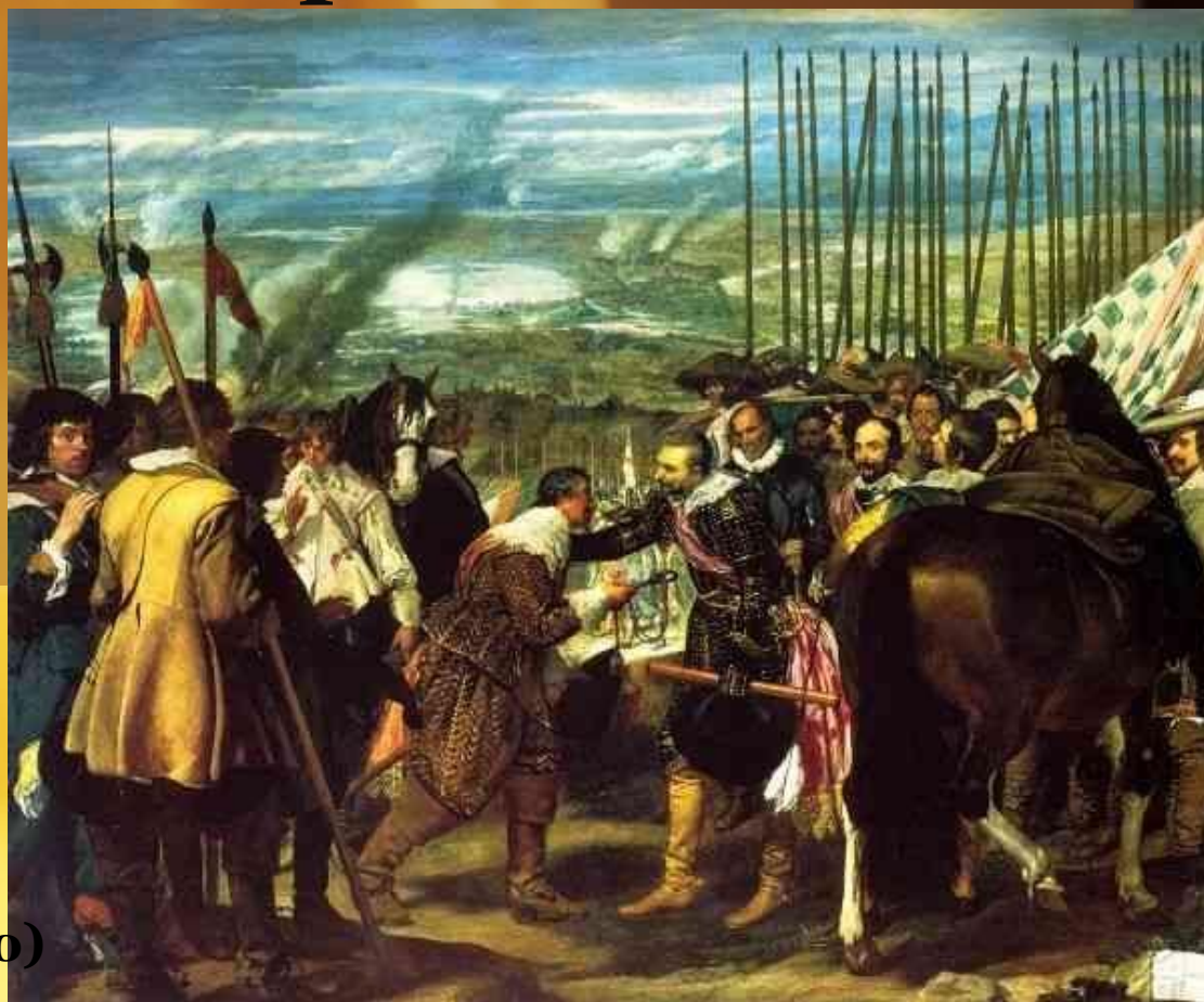
Сдача Бреды Веласкеса (1629-1631, Мадрид, Прадо)