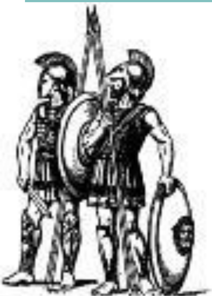
Скиты и персы