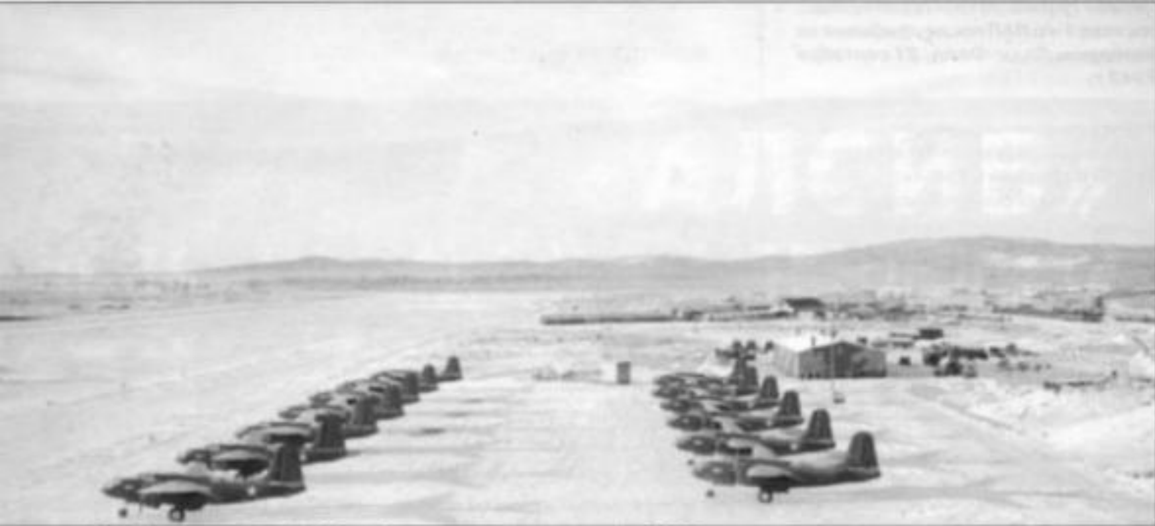
бомбардировщики А-20 на Аляске перед отправкой в СССР

один из первых В-25, перегнанных в Советский Союз по трассе «АлСиб» осенью 1942 года