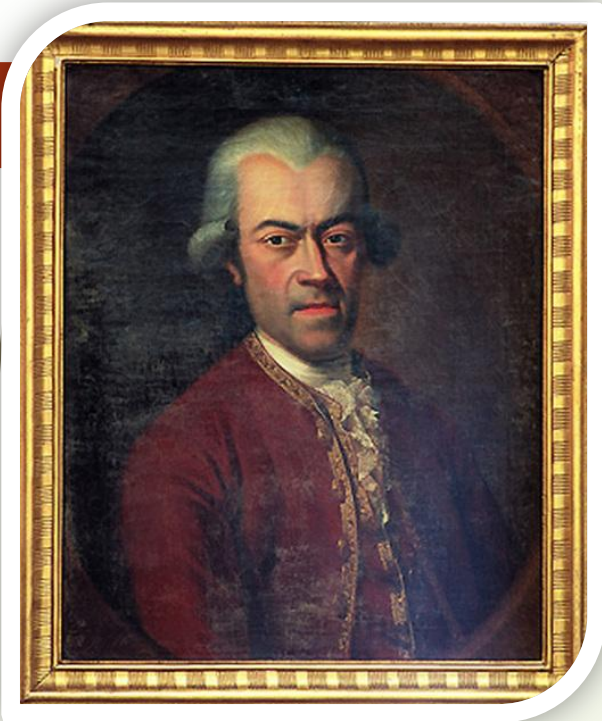
Август Людвиг Шлецер (1735-1809)

Надо признать, что история России поражала и влекла Шлецера своими масштабами, но он не был достаточно подготовлен к ее научному изучению. Историк признавался, что не способен написать сколь-нибудь хорошую историю России для серьезных читателей. Однако Шлецер имел превосходную подготовку к историко-критической работе. В этом направлении и сосредоточилось все его внимание. Изучение источника и его критика — тема «Нестор» — стали основными в его научной работе. В «Несторе» Шлецер сформулировал общие принципы и описал технические приемы проведенной им критики текста.