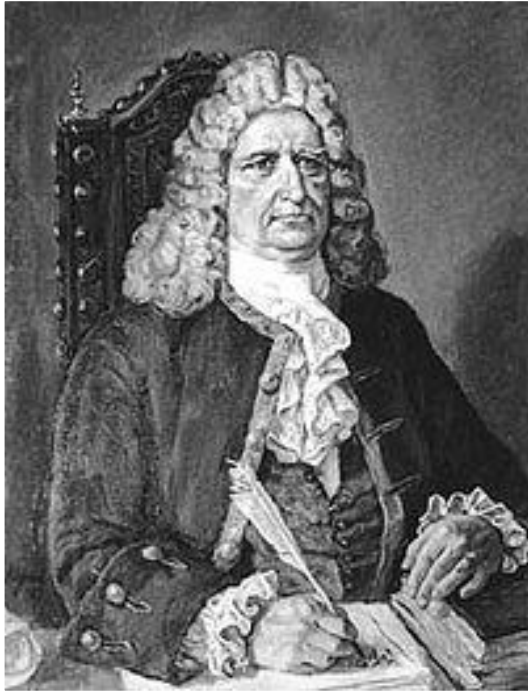
Герард Фридрих Миллер (1705-1783).

Миллер создает первый в России исторический журнала («Собрание российской истории»), на нем. яз. с 1732 г. В журнале печатались источники и статьи по русской истории, как отечественные, так и иностранные.. Именно в этом журнале началась публикация Начальной русской летописи.