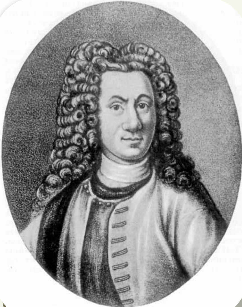
Байер Готлиб Зигфрид

Русской историографии, чтобы стать полноценным научным знанием, действительно недоставало критики источников , и Байер чутко уловил эту потребность . Будучи профессиональным ученым, то есть имея казенную квартиру и 600 рублей жалованья, Байер не особенно нуждался в читающей публике и мог позволить себе заняться черновой исторической работой – критикой слов. Древнерусские письменные памятники были для него малодоступны, но, слава Богу, существовали источники греко-латинские, немецкие и скандинавские, изучение которых для иностранца было легче всего. В эту сторону и направил свои усилия неутомимый преподаватель классических языков.