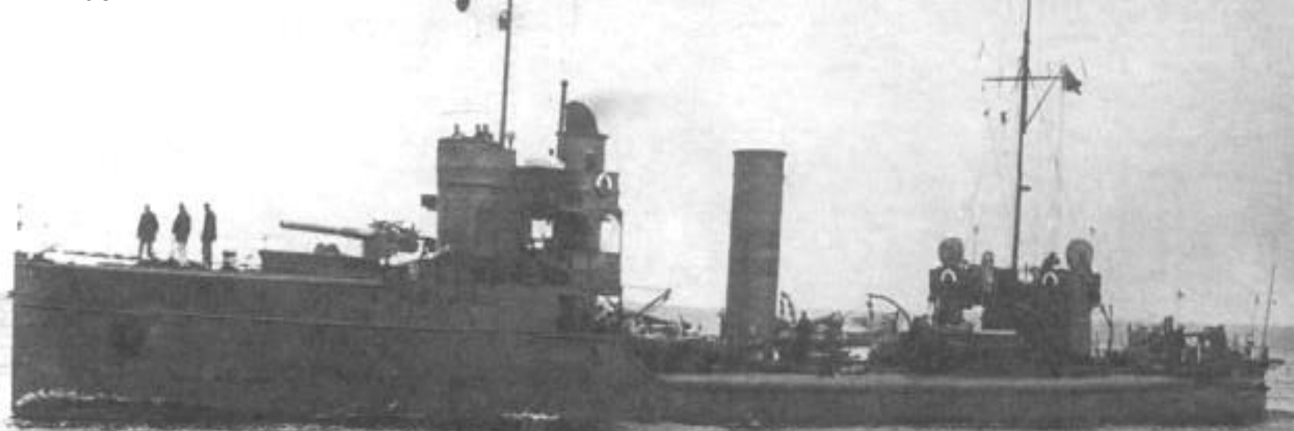
Корабли Балтийского флота. Фотография времён второй мировой войны.

В марте 1945 года Гитлер приказал удерживать эту крепость до последней возможности. Цитадель и форты Пиллау, хотя и относились к старой постройке, могли выдержать снаряды большой мощности. Это были батареи, механизированные по последнему слову техники: с бронированными дверями, с двухметровыми стенами и перекрытиями, имевшими, помимо радиолокаторов и дальномеров, свое подземное хозяйство: ремонтные мастерские, артиллерийские погреба, машинное отделение, коммутатор, запасные баки с водой, склад для горючего, водопровод, канализацию, вентиляцию, калорифер для подогрева воздуха. Опираясь на шоссейную и железную дороги, противник мог маневрировать силами, формировать и посылать в бой новые части.