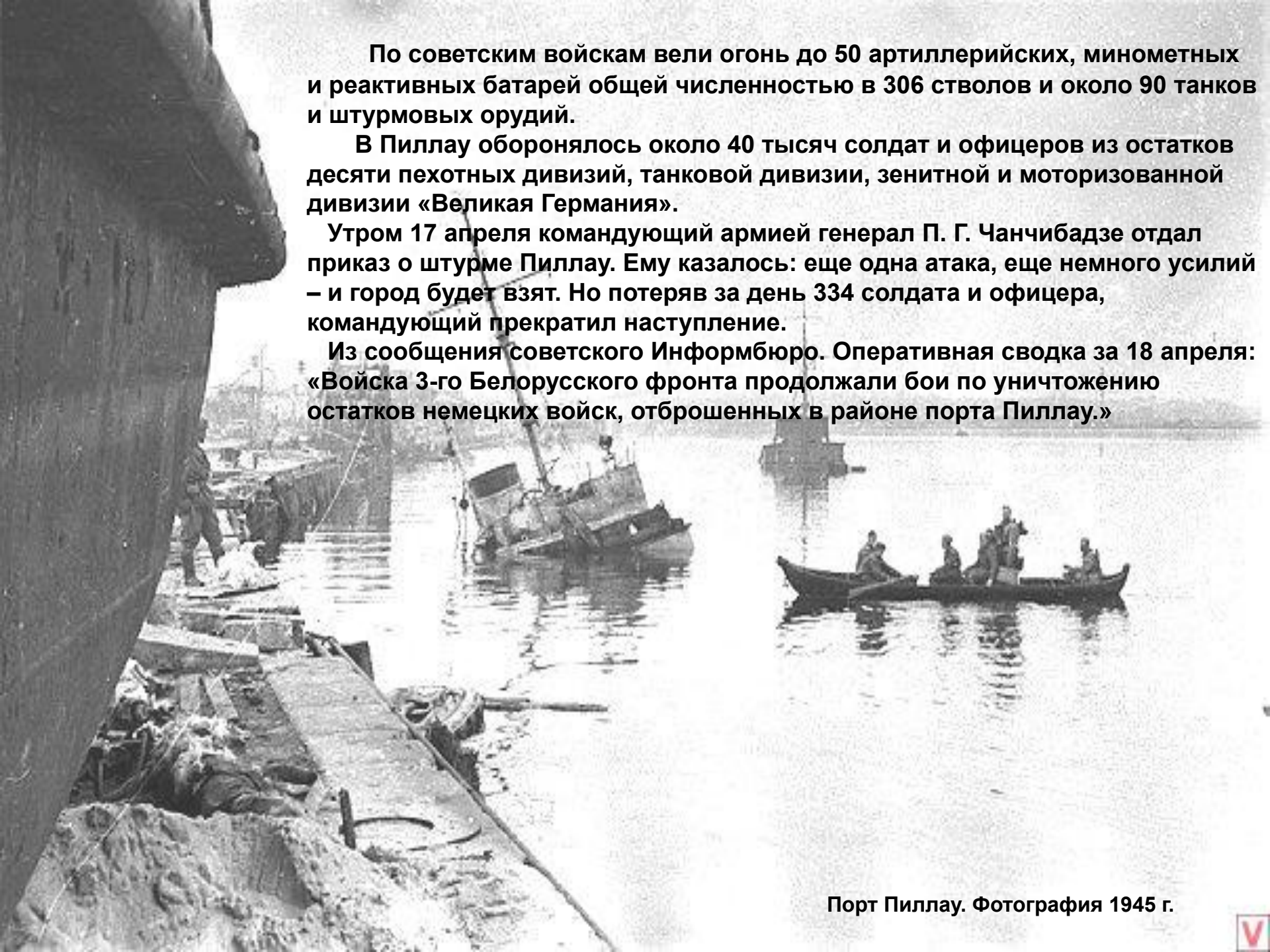
Порт Пиллау. Фотография 1945 г.

Из сообщения советского Информбюро. Оперативная сводка за 18 апреля: «Войска 3-го Белорусского фронта продолжали бои по уничтожению остатков немецких войск, отброшенных в районе порта Пиллау.»