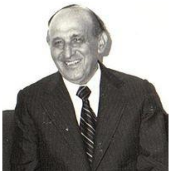
Тодор Живков, генеральный секретарь ЦК БКП (1954—1989)

В августе 1943 года царь Борис III скоропостижно скончался после встречи с Гитлером (возникли слухи о его отравлении). После смерти царя на престол вступил его шестилетний сын Симеон II . Фактически государством стали управлять его регенты . Правление юного царя было недолгим - ему пришлось вместе с семьей бежать в Египет , а потом в Испанию , так как после референдума 15 сентября 1946 была провозглашена Народная Республика Болгария . Республика развивалась по социалистическому пути вплоть до конца 1989 года , когда страна вышла из-под влияния СССР .