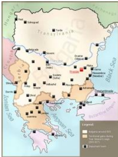
Первое Болгарское Царство при Симеоне

После смерти Кубрата государство распалось и сыновья хана, каждый со своим племенем откочевали в разные направления [1] . Один из сыновей Кубрата — Аспарух , со своим племенем занял земли за рекой Днестр на северо-западном побережье Чёрного моря. Там он вошёл в союзные отношения с местными славянскими племенами и в 681 году основал Болгарское государство, так называемое Первое Болгарское царство [2] . Официальной точкой отсчета существования Первого Болгарского Царства является подписание договора болгар с Византией после военного поражения последней в устье Дуная, по которому Византия обязалась платить болгарам дань. Столицей государства стал город Плиска . В состав государства вошли протоболгары, славяне и небольшая часть местных фракийцев . Впоследствии эти этносы образовали народ славянских болгар , получивших название по стране и говоривших на языке, от которого произошёл современный болгарский. В начале IX века территория государства существенно расширилась за счёт завоёванного Аварского каганата .