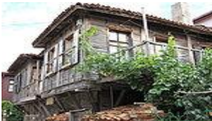
типичный болгарский строительный метод

До 865 года правители Болгарии носили титул хана ; при царе Борисе страна официально приняла христианство (от Византии, по восточному обряду), и правители стали носить титул князя, а затем царя. При царе Симеоне государство достигло своего геополитического апогея и включало территории современных Болгарии, Румынии , Македонии , Сербии , восточную часть современной Венгрии , а также южной Албании , континентальную часть Греции , юго-западную часть Украины и почти всю территорию европейской Турции . Столицей стал Преслав , в противовес бывшей языческой столице. При Симеоне Болгарское государство также пережило небывалый культурный расцвет, начавшийся с создания письменности Кириллом и Мефодием , был создан огромный корпус средневековой болгарской литературы.