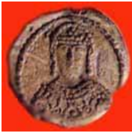
Печать царя Симеона