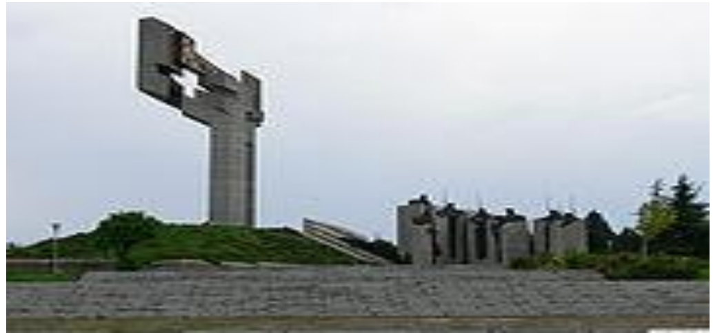
Памятник защитникам Стара-Загоры

В конце XIV века Болгария была завоёвана Османской империей . Сначала она находилась в вассальной зависимости, а в 1396 году султан Баязид I аннексировал её после победы над крестоносцами в битве при Никополе . Результатом пятисотлетнего турецкого правления было полное разорение страны, уничтожение городов, в частности, крепостей, и уменьшение населения. Уже в XV веке все болгарские органы власти уровнем выше коммунального (сёл и городов) были распущены. Болгарская церковь потеряла самостоятельность и была подчинена константинопольскому патриарху.