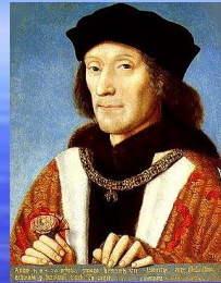
Генрих VII 1455 – 1509 король Англии