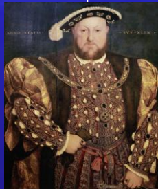
Генрих VIII 1491 – 1547 король Англии