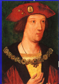
Артур 1486 – 1502 принц Уэльский