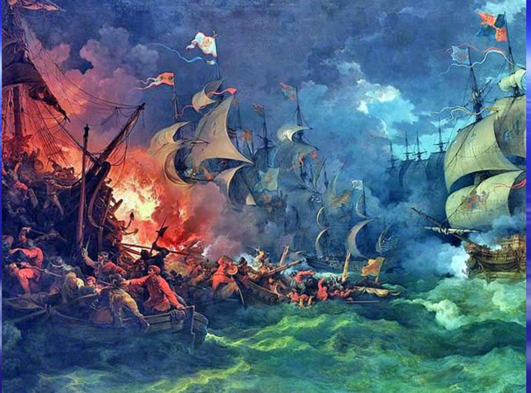
Битва испанского и английского флота