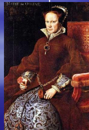
Мария I 1516 – 1558 королева Англии