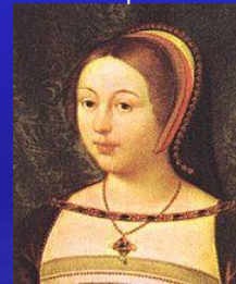
Маргарита 1489 – 1541 королева Шотландии