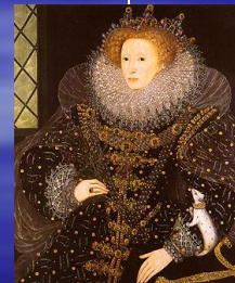
Елизавета I 1533 – 1603 королева Англии