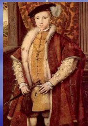
Эдуард VI 1537 – 1553 король Англии