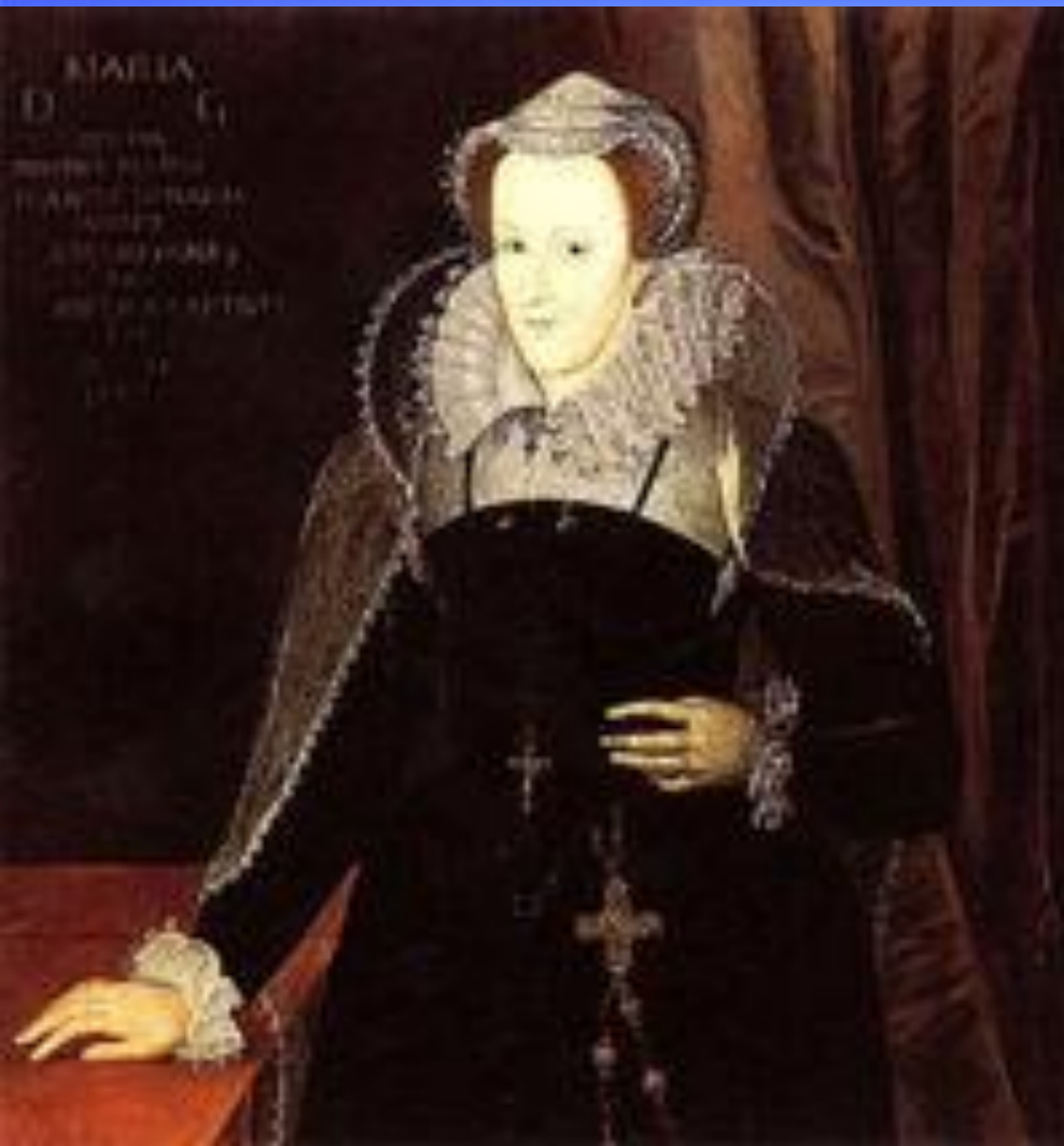
Мария Стюарт королева Шотландии