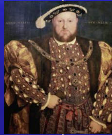
Генрих VIII 1491 – 1547 король Англии