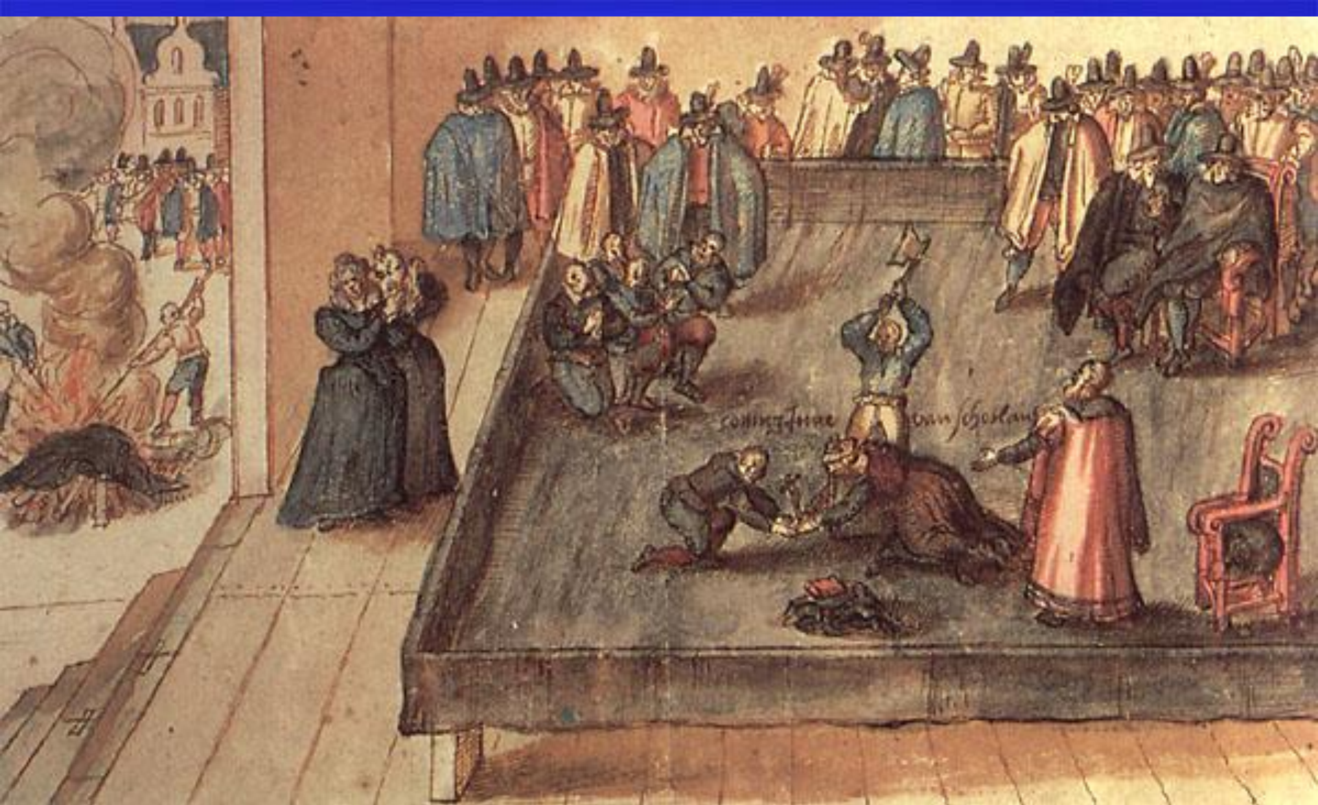
Казнь Марии Стюарт