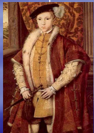
Эдуард VI 1537 – 1553 король Англии