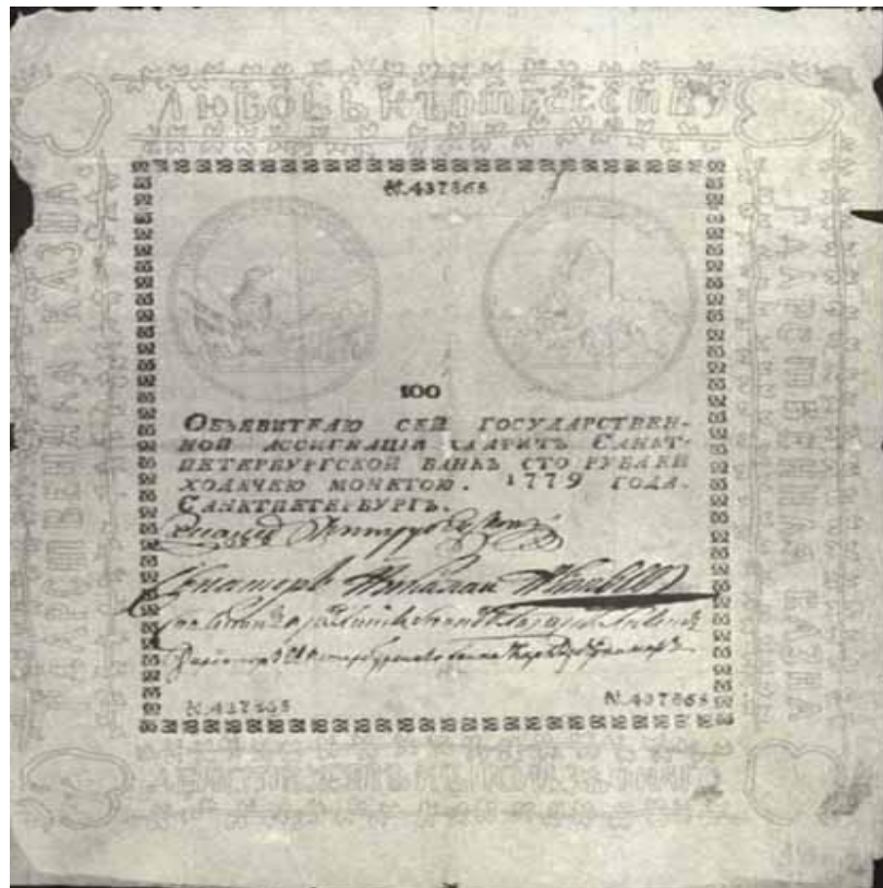
Ассигнация Екатерины II на сто рублей.

Первые русские ассигнации были очень просты по оформлению. Это были большие листы белой бумаги размером 175 x 225 мм, обрамленные черной рамкой. Посередине располагался номер ассигнации, в центре листа -- обозначение номинала, ниже располагался текст обязательства и в самом конце собственноручные подписи сенаторов, главного директора правления банков и директора местного банка. Неудивительно, что такие деньги было легко подделать.