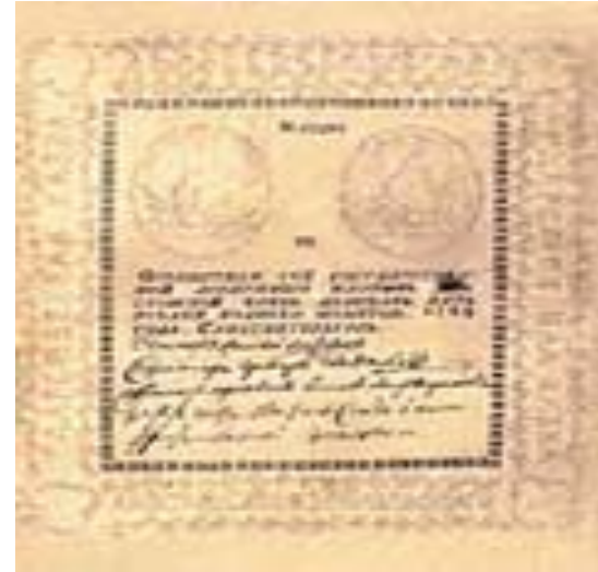
Ассигнация достоинством в 5 рублей. 1769.