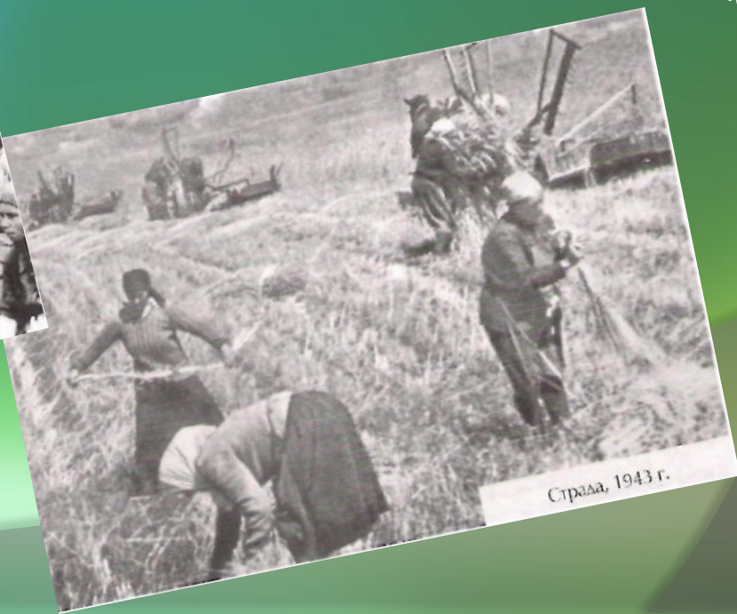
Страда, 1943 г.