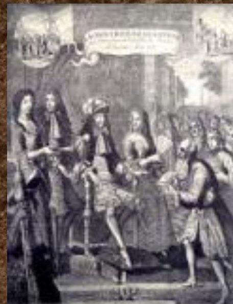
Прием русского посольства у Луи XIV, 1681 год

• Дипломатические поминки были двух разновидностей - официальные, направленные от монарха к монарху, и частные - от самих послов. Иностранные дипломаты в России и русские за границей постоянно подносили дары не только от своих государей, но и от себя лично. По большей части эти дары перед отъездом русских послов за рубеж выдавались им из казны. В казну они должны были вернуть и ответное «жалованье» иностранного монарха: наиболее ценные вещи царь оставлял у себя, остальное отдавалось послам.