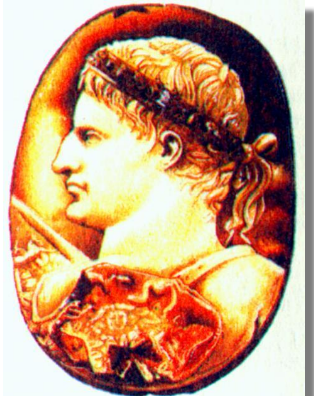
Октавиан. Древнеримская камя.

Октавиан, обвинял соперника в разбазаривании земель, которые тот дарил жене и дочерям.