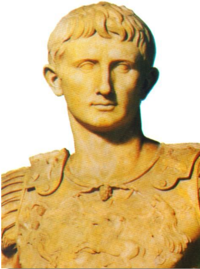
Октавиан Август- Император.

В 30 г до н.э. Октавиан объявил об окончании гражданских войн.