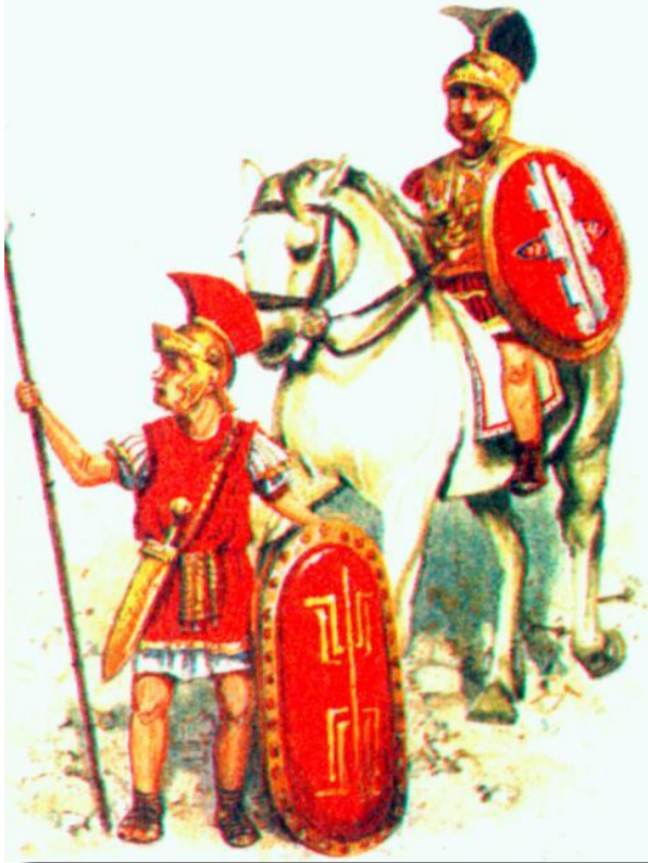
Отставные преторианцы в Сирии.

Октавиан сократил численность армии. Отставные воины были поселены в провинциях, а пособия им платили из сокровищ египетских царей.