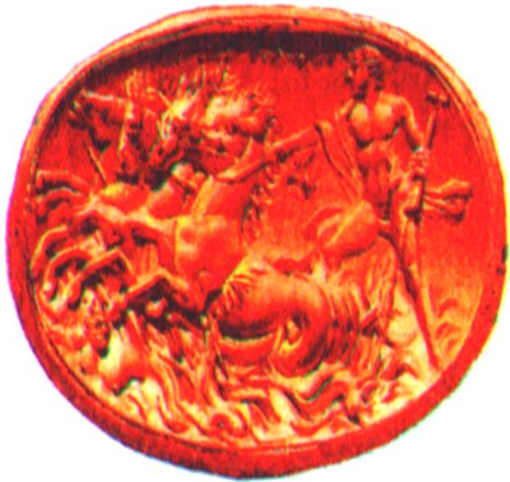
Октавиан в образе бога моря Нептуна. Древнеримская гемма.

В 31 г. до н. э. началась гражданская война между двумя правителями.