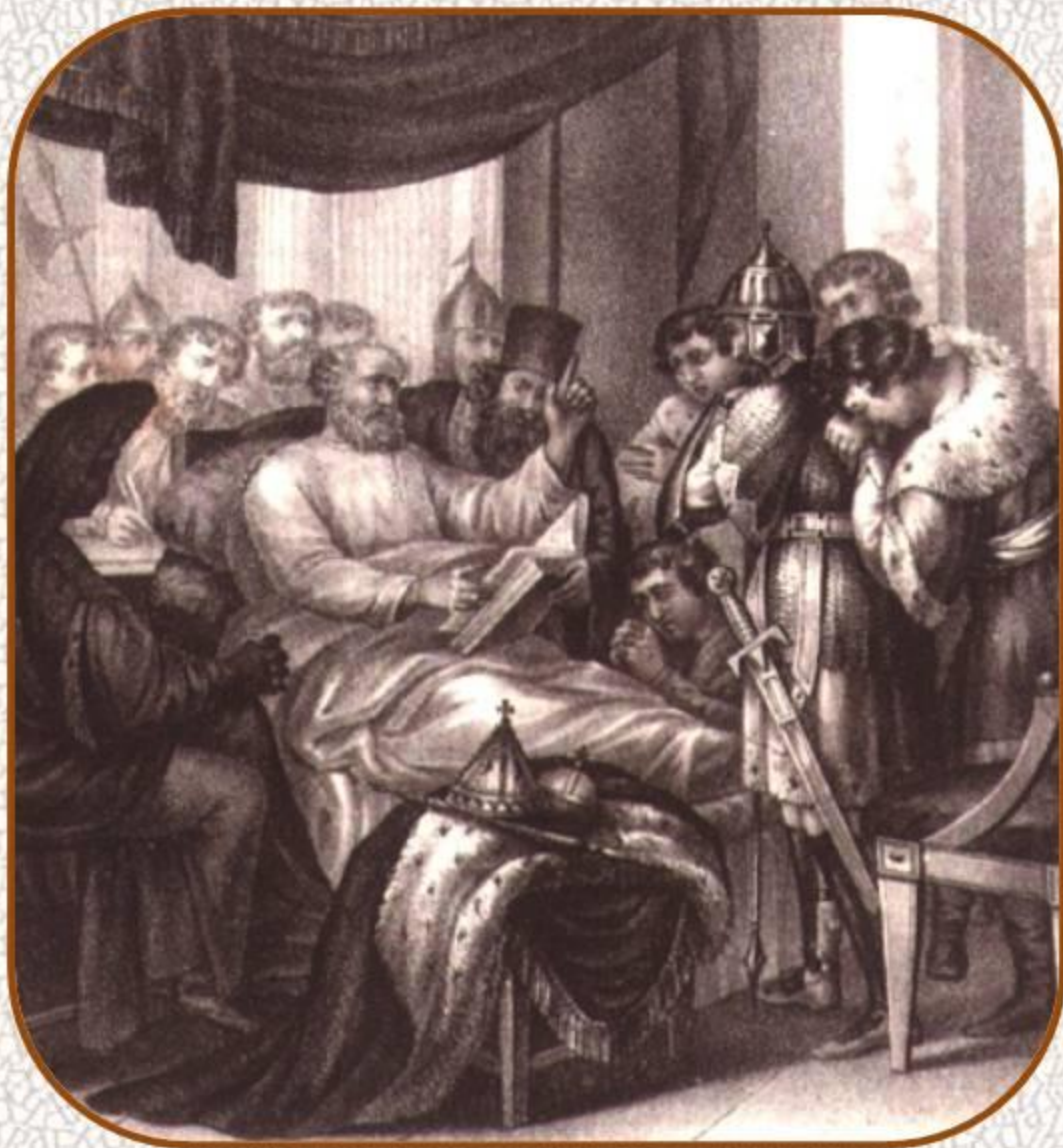
Завещание Владимира Мономаха детям. Литография по рисунку художника Бориса Чорикова. 1836 год

Из «Поучения» мы можем узнать о детстве и юности Владимира, о его верности православной вере, о его любви к церковной службе и молитве, заботе о своих подданных, об отношении к самому себе и другим людям.