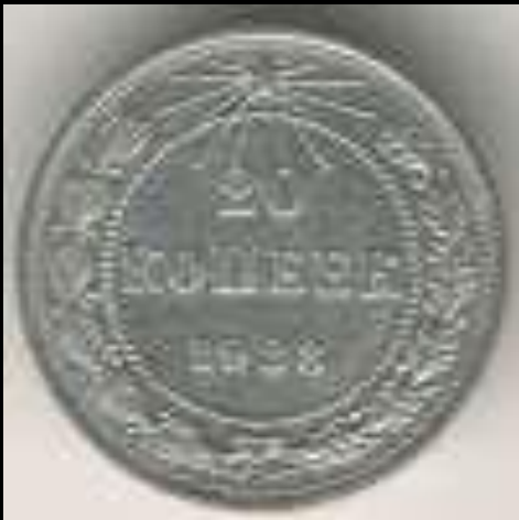
20 копеек 1923 г