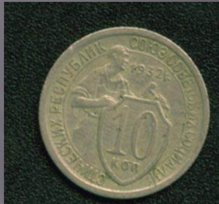
10 копеек 1932г