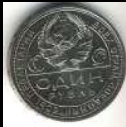
1 рубль 1924 г