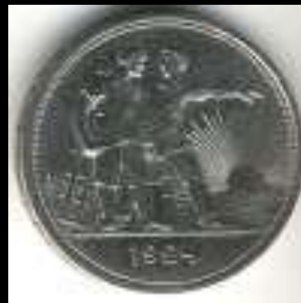
Рабочий и крестьянин