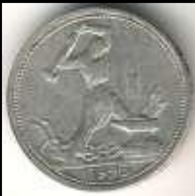
50 копеек 1925 г