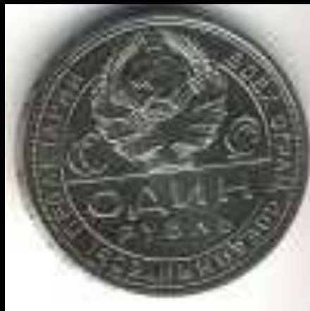
1 рубль 1924 г