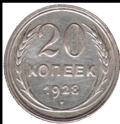
20 копеек 1928 г