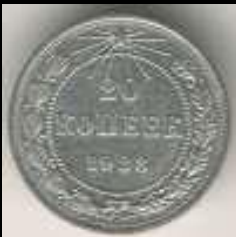
20 копеек 1923 г