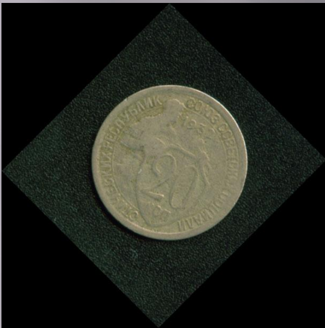
20 копеек 1932г