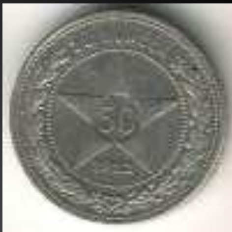
50 копеек 1922г.