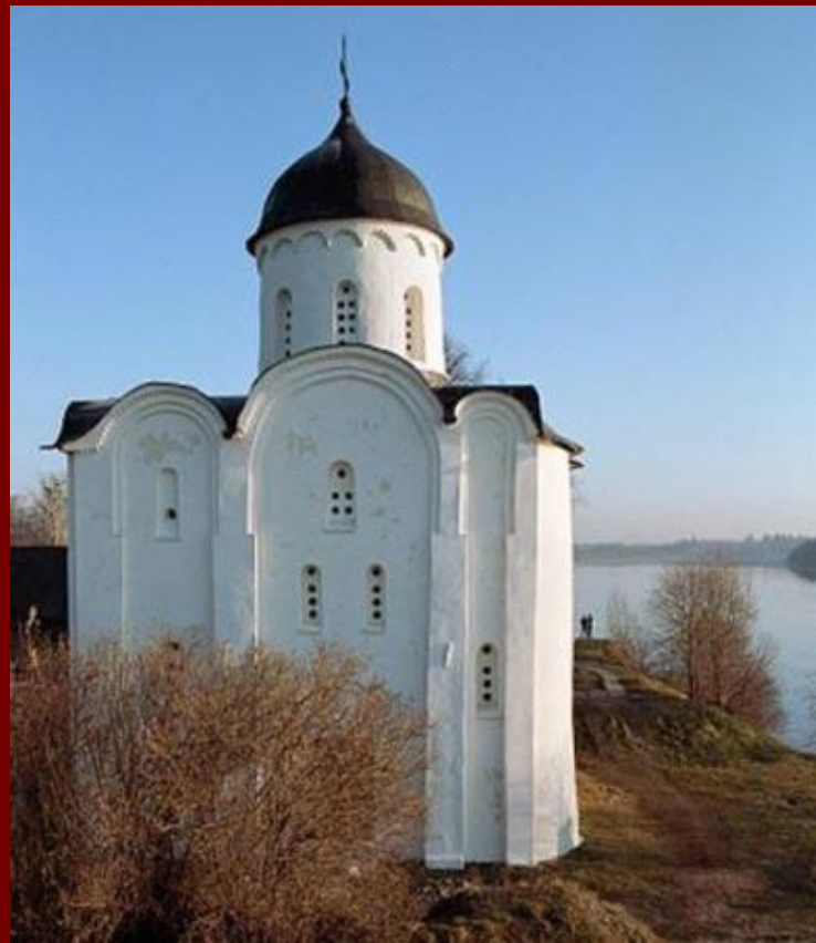
Храм 12 века, Старая Ладога