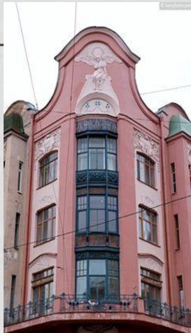
Доходный дом П. Т. Бадаева (Дом печального ангела)

Твои потаенные мысли, Наяды твои и Дриады, Как ветром гонимые листья Летят, облепляют фасады