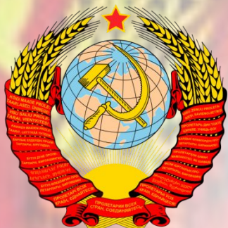
Герб СССР (1936-1956)