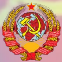
Герб СССР (1923-1936)

Изменения вносились при присоединении союзных республик, образовавших в 1922 Союз ССР