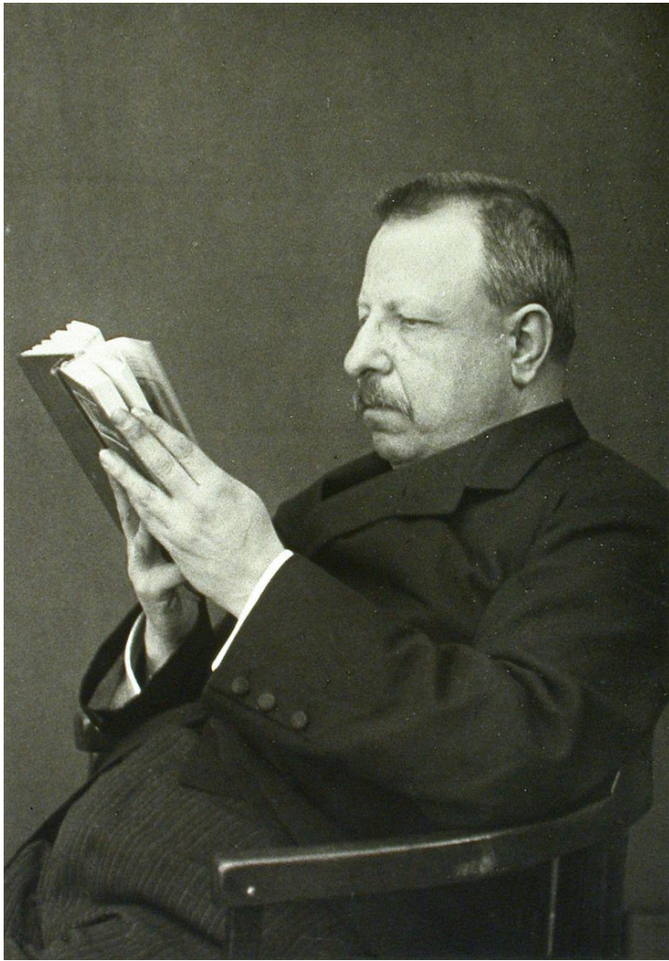
Бенедетто Кроче (1866–1952)

Историю нельзя построить на пересказах — только на документах, либо на пересказах, ставших документами.