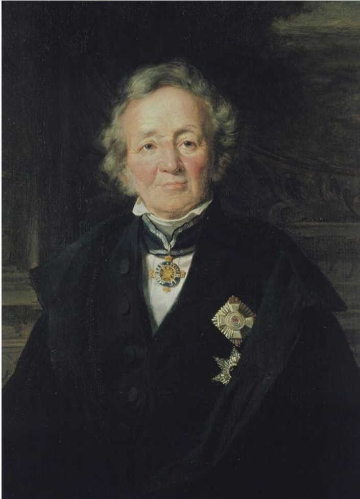
Леопольд фон Ранке (1795— 1886)

... история возложила на себя задачу судить о прошлом, давать уроки настоящему на благо грядущих веков. На эти высокие цели моя работа не претендует. Ее задача — лишь показать, как все происходило на самом деле.