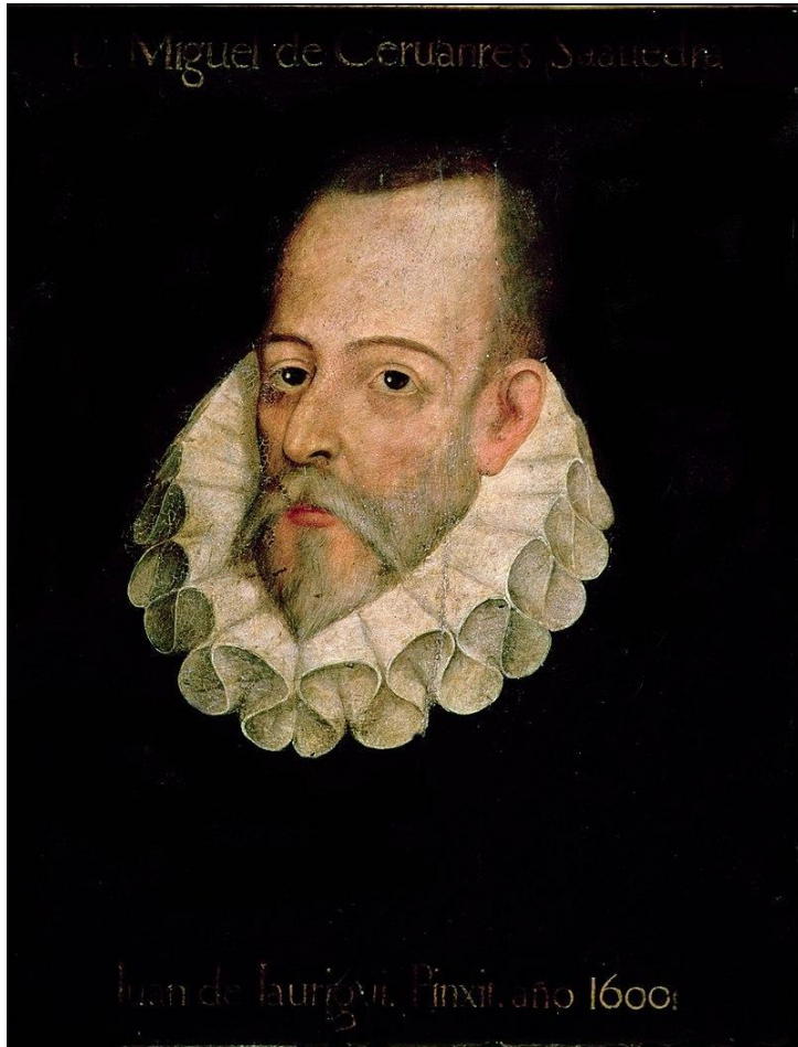
Мигель де Сервантес Сааведра

История — сокровищница наших деяний, свидетельница прошлого, пример и поучение для настоящего, предостережение для будущего.