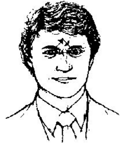
Рис. 106. Деловой взгляд.