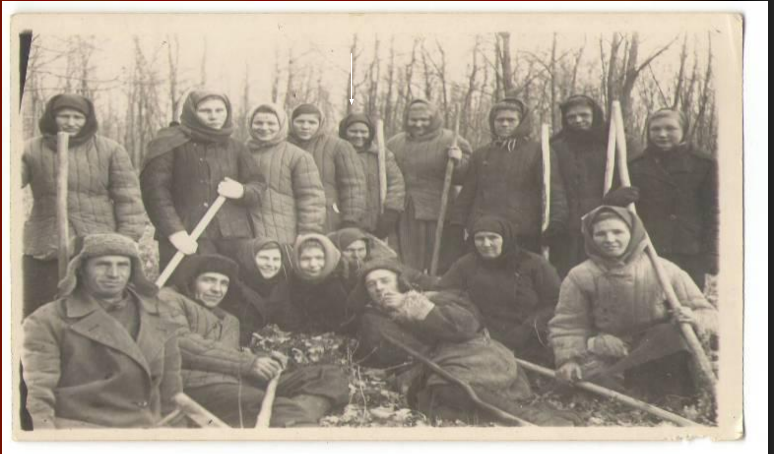
Моя прабабушка в лесу после войны.