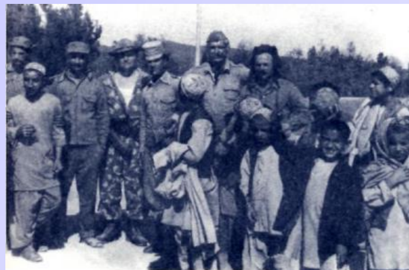
В ОСВОБОЖДЁННОМ КИШЛАКЕ