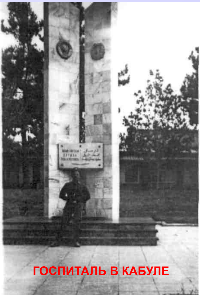
ГОСПИТАЛЬ В КАБУЛЕ

Из аэродрома Грозного отправили в Ташкент на пересыльную базу, оттуда на военном тяжелом самолёте вместе с техникой отправили в Кабул.