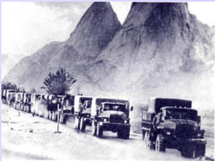
КОЛОННА С ПРОДОВОЛЬСТВИЕМ