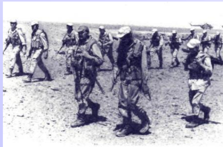
РОТА НА ЗАДАНИИ